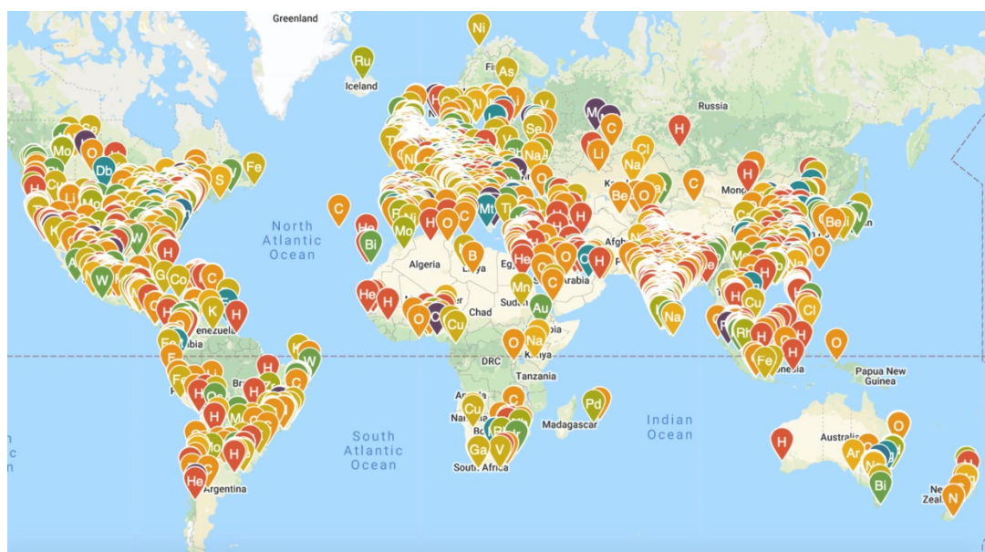
Fig. 2 - I giocatori della PT Challenge nel mondo, rappresentati da pin di elementi chimici

Il giocatore, una volta registratosi e scelto un elemento chimico come proprio "avatar", seleziona il livello di difficoltà desiderato tra tre disponibili (principianti, intermedio e avanzato) e risponde a 10 domande a risposta multipla, estratte casualmente tra le oltre 100 esistenti per ciascun livello, ognuna di esse incentrata su un elemento della Tavola Periodica. Alla fine della sfida il giocatore visualizza la sua percentuale di successo e tutte le domande affrontate, insieme alle risposte selezionate e a quelle corrette, avendo così l'opportunità di imparare anche dagli errori commessi. Il punteggio conseguito va a contribuire a quello dell'elemento scelto come avatar e quindi al suo posizionamento in una classifica globale degli elementi. I giocatori, sempre attraverso l'elemento avatar, vengono anche visualizzati su planisfero che si popola in modo dinamico di pin di elementi chimici (Fig. 2). È possibile partecipare come singoli giocatori, ma anche come membri di un'istituzione scolastica o accademica, le più attive delle quali, oltre a ricevere una menzione da IUPAC, concorrono per l'assegnazione di una tavola periodica firmata da uno scienziato insignito del premio Nobel.