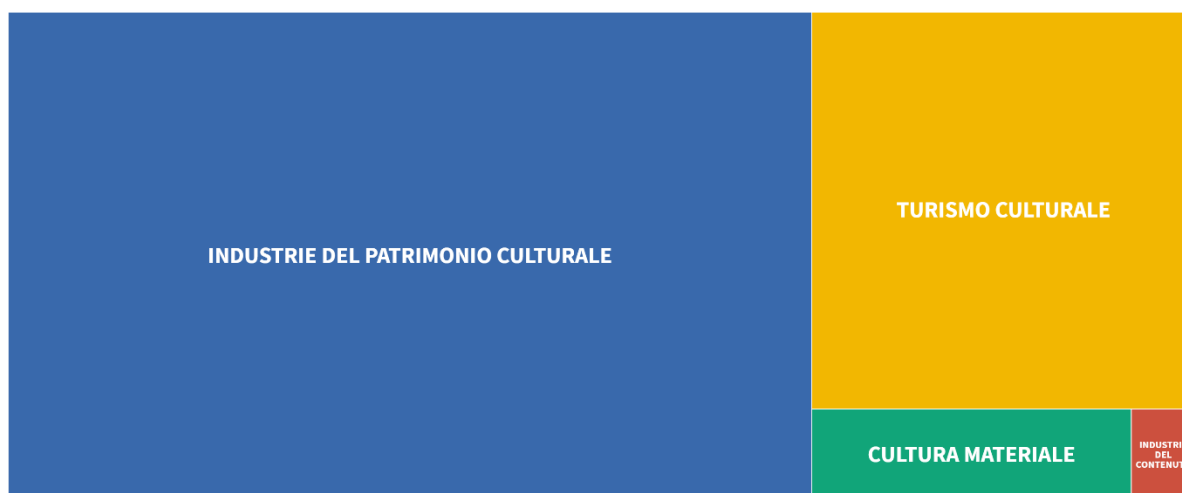
Figura 2 – Settore prevalente nelle attività progettuali dall'analisi dei progetti candidati nelle edizioni 2011-2014. Fonte: elaborazione dei dati propria.

I progetti candidati prevedono attività per la maggior parte incluse nel settore delle industrie del patrimonio culturale, settore a cui faceva esplicito riferimento il bando. È tuttavia interessante notare come gli altri settori in cui i progetti candidati agiscono sono il turismo culturale e la cultura materiale (Figura 2).