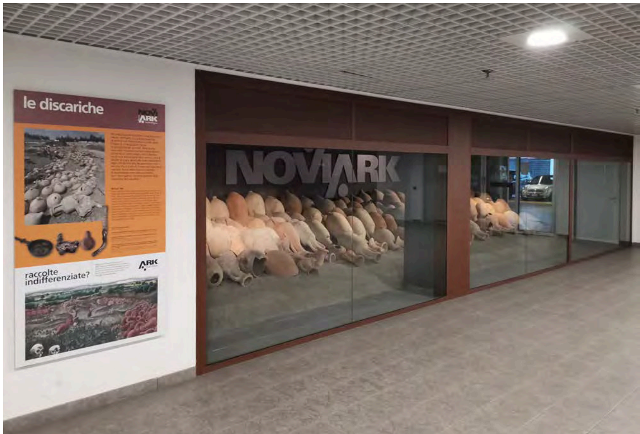
4: Modena. Musealizzazione, all'interno del Parcheggio del Centro, delle anfore ritrovate durante i lavori di scavo (Riccardo Rudiero).

In tutti questi esempi, la presentazione dei reperti e la narrazione pensata per un'utenza in transito e non per forza interessata ai fatti storici riesce a rendere eloquente la stratigrafia, generando nuove immagini della città antica, strettamente connessa anzi, immersa, in quella odierna. Addirittura, questi spazi si potrebbero considerare non come musei, siti archeologici o stazioni, ma «una nuova categoria di edificio – inedito, diverso, condiviso, collettivo, compreso, comunicativo – in grado di mettere in relazione fatti sconnessi e lontani tra loro, sia spazialmente sia temporalmente, in una nuova contemporaneità» [Segarra Lagunes 2013, 38].