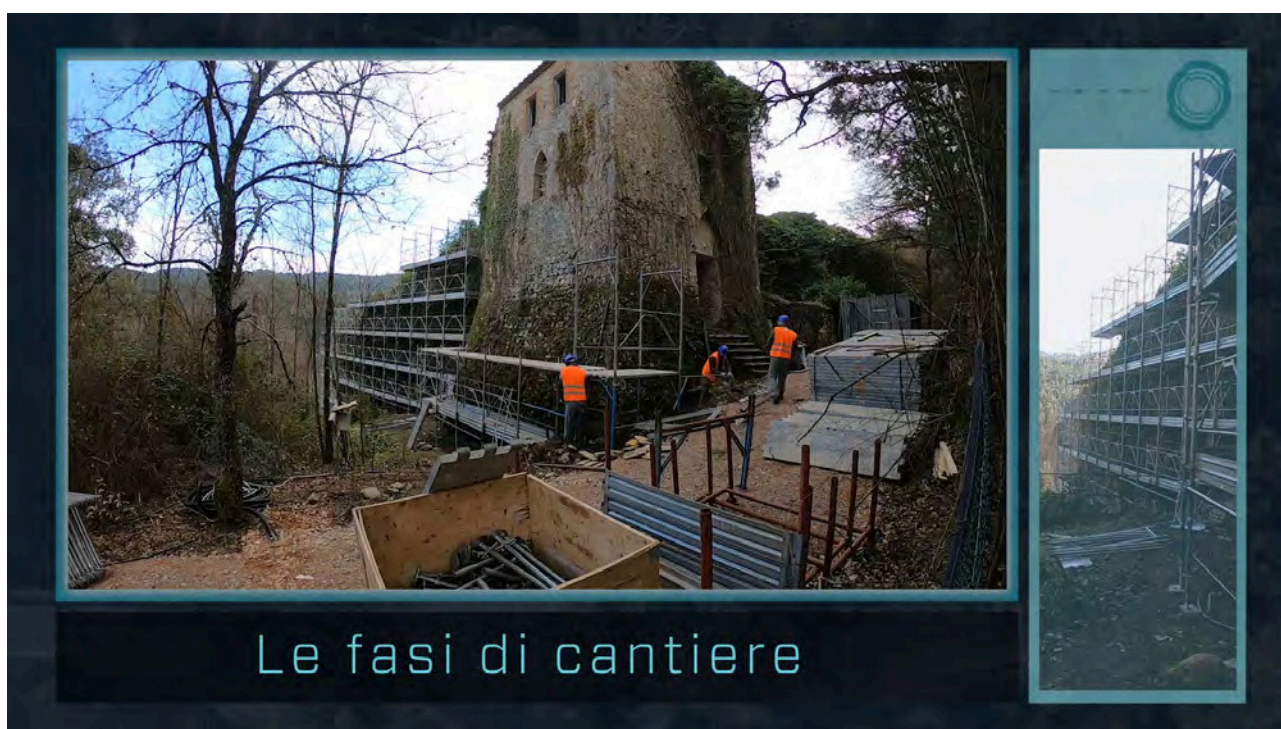
5: fotogramma di una puntata del progetto di live restoration "Bagni di Petriolo. Cronache di un cantiere di restauro", riguardante il montaggio delle impalcature per il restauro della torre nord del complesso senese.

Da queste considerazioni e presupposti ha tratto linfa il percorso di ricerca finalizzato alla live restoration , ossia un sistema multidisciplinare di progettazione e comunicazione volto a rendere evidenti non solo gli effetti del restauro, ma l'intera processualità tecnica di esecuzione, le istanze teoriche che sottendono l'intervento e le ricerche storiche che hanno informato il progetto [Rudiero 2017]. Esso esprime le sue potenzialità specialmente attraverso la multimedialità, facendo largo uso di social media e siti web all'interno dei quali reperire informazioni sul bene culturale oggetto di intervento [Arrighetti, Minutoli, Rudiero 2019]. Attualmente la live restoration è in sperimentazione nel cantiere del villaggio fortificato di Bagni di Petriolo (SI), per il quale si sta approntando una serie di videodiarî (disponibili su YouTube) sulla storia del sito, la progettazione delle azioni conservative e la loro esecuzione, onde mettere in atto una pubblicizzazione in ogni fase del processo di restauro. Così facendo non viene scissa l'operatività dalla valorizzazione, aprendo la possibilità di ripensare il cantiere che, non più inteso tradizionalmente, impegna i responsabili a sperimentare modelli di comunicazione e divulgazione in itinere , rispondendo alla duplice esigenza documentaria e disseminativa [Rudiero 2014].