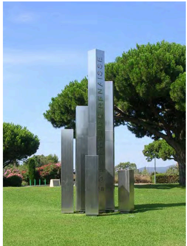
1-2: Fréjus. Antiche colonne doriche affiancate a sculture contemporanee, presso il parco di Malpasset-Amphithéâtre.