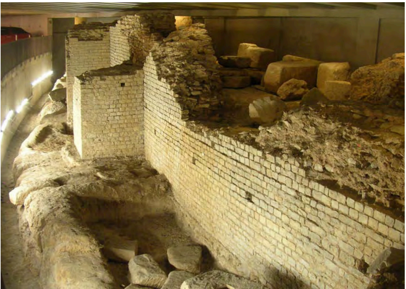
3: Cahors. I ruderi dell'anfiteatro inseriti all'interno di un parcheggio pubblico. (Emanuele Romeo).