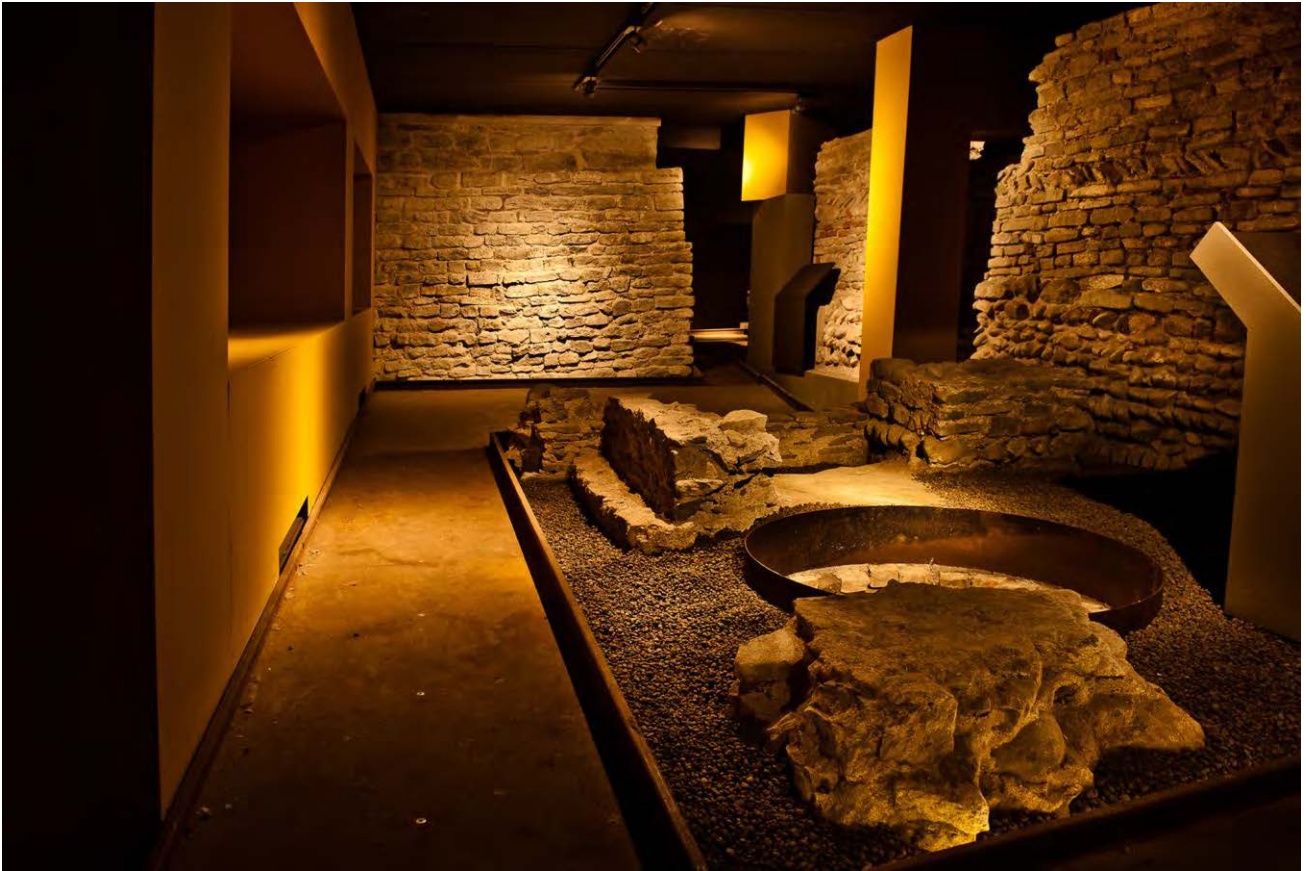
3: Alba Sotterranea, Alba (CN: i resti dell'antico foro romano costituiscono la prima tappa del percorso archeologico cittadino.

storiche di Alba Pompeia attraverso la creazione di un percorso archeologico cittadino che mette in connessione un vero e proprio sistema di beni sotterranei di proprietà pubblica, privata ed ecclesiastica. Il percorso si snoda all'interno della città in 32 tappe segnalate da pannelli esplicativi che consentono ai visitatori, accompagnati da un archeologo professionista, di conoscere la storia di Alba attraverso le tracce sotterranee di epoca medievale e romana. L'itinerario di visita conduce infatti i visitatori alla scoperta dei resti del foro romano, del teatro e dell'anfiteatro romani, di alcune domus , delle mura di cinta romane, dei selciati stradali, di torri e chiese medievali, e si conclude presso le sale della sezione archeologica del Museo Civico, nelle quali è conservata ed esposta una ricca collezione di reperti archeologici della città di Alba e del suo territorio. L'esperienza di visita all'esterno viene integrata con un percorso museale che, mediante l'uso di pannelli informativi, aiuta i visitatori a ricostruire le trasformazioni e lo sviluppo storico e urbanistico di Alba. L'iniziativa 'Alba Sotterranea' contribuisce a generare affezione ai luoghi e a sensibilizzare la collettività alla cura del proprio patrimonio culturale. Inoltre, il ruolo attivo dell'Associazione Ambiente & Cultura fa leva su valori locali e sul senso di comunità garantendo la riscoperta della propria storia e identità culturale.