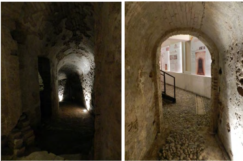
1: Area archeologica Rivellino degli Invalidi, Torino: valorizzazione e musealizzazione dei resti del sistema difensivo seicentesco torinese. Autore: Manuela Mattone.

dell'ampliamento seicentesco della città e della galleria Magistrale del sistema di 'contromina'.