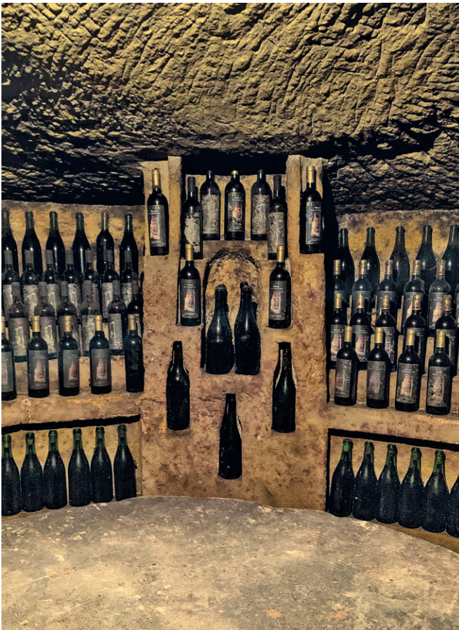
04. Infernot, Monferrato. Asja Aulizio

go termine. Il paesaggio culturale è infatti un outstanding universal value , poiché racchiude un “significato culturale e/o naturale talmente eccezionale da trascendere i confini nazionali e da essere di comune importanza per le generazioni presenti e future” (World Heritage Convention, 2019). La ricerca condotta finora è quindi composta da interventi di monitoraggio del territorio (il rilievo olistico) e di pianificazione (il progetto sistemico). I tre risultati auspicati si declinano nel creare un’economia sostenibile come outcome , delineare prodotti e servizi inclusivi per la comunità come output e infine migliorare i sistemi di gestione locale della produzione e del consumo (img. 05) (UNESCO et al. , 2013).