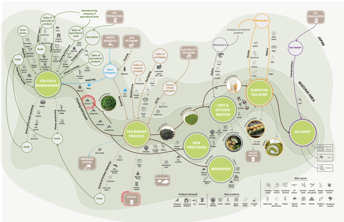
06. Applicazione design sistemico: filiera del tè verde a Uji, Kyoto. Systemic design application: green tea supply chain in Uji, Kyoto. Asja Aulisio, Eva Vanessa Bruno

rurali dopo gli studi per portare avanti l'attività di famiglia. È presente una forte eredità culturale portata avanti da eventi locali che celebrano la tradizione gastronomica dei prodotti del territorio. Inoltre, le architetture tipiche vacanti offrono