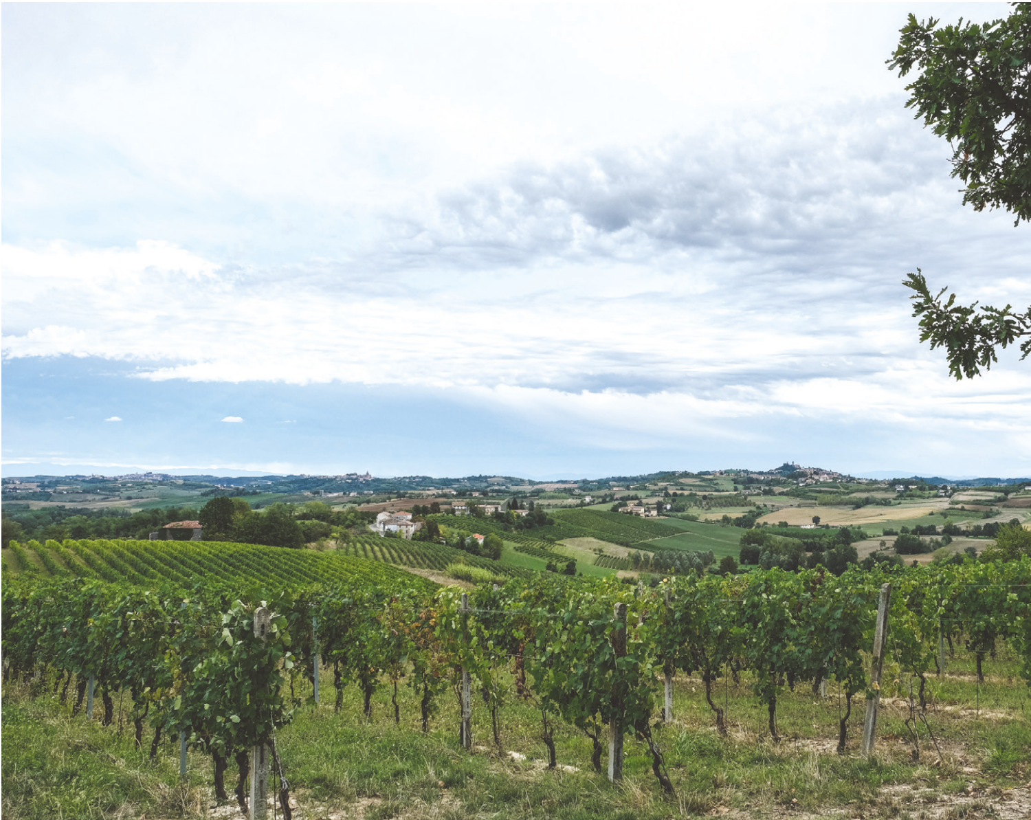
01. Cella Monte, Monferrato. Asja Auliso