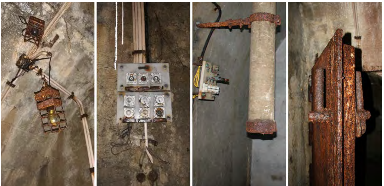
5: Alcuni dettagli dei dispositivi che è ancora possibile apprezzare all'interno del rifugio. Da sinistra: gabbia metallica contenente una lampadina, quadro elettrico, tubatura di areazione, porta blindata.

Ciò che appare di notevole suggestione, oltre ai luoghi e alla loro connotazione storica, è la possibilità di riscontrare, anche all'interno dei rifugi – ad esempio in quello di Porta Nuova – come esista un sistema di beni, anche all'interno al bunker stesso. Il luogo, forse ancora di più per la sua povertà decorativa e per le poche tracce superstiti consente la visione di una costellazione di piccole rimanenze attraverso le quali la memoria dei luoghi sembra riaffiorare