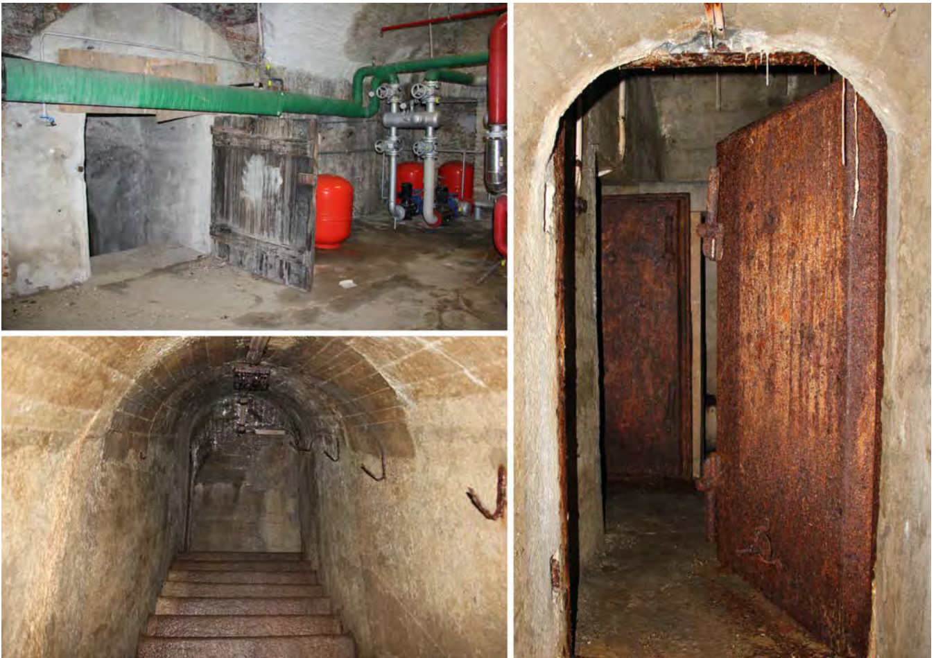
4: L'accesso al rifugio dai locali interrati della stazione, la scala e le porte blindate che introducono all'ambiente principale.