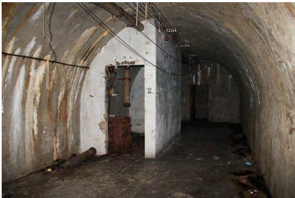
2: Il rifugio della stazione di Porta Nuova.