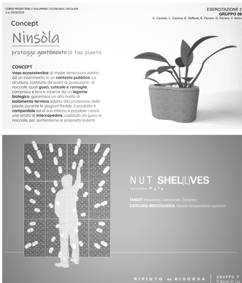
Figura 4 - Scenari di riuso di cuticole e gusci proposte dagli studenti [Elaborazione degli studenti].

Per quanto attiene la cuticola di nocciola, sono stati sperimentati dei