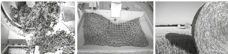
Figura 1 – Scarti della filiera vitivinicola (SX), corilicola (C) e cerealicola (DX) [Elaborazione J. Andreotti].

Lo studio delle filiere di uva, nocciola e frumento è stato condotto attraverso un approccio metodologico rivolto alla comprensione delle fasi che generalmente caratterizzano la produzione "lineare", cioè in assenza di processi finalizzati al recupero e riciclo della materia: dal campo, alla raccolta, ai processi di lavorazione, fino al prodotto finito. Cruciale in tal senso è stata l'indagine effettuata sui processi che generano scarti (output), individuando in particolare la tipologia, le percentuali e i quantitativi potenzialmente disponibili (tab.1). Per stimare la