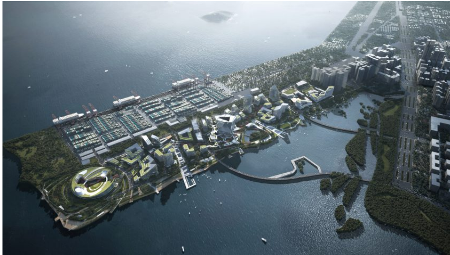
Figura 5 | Tencent Net City, NBBJ, 2020.

considerata un enorme available space , ovvero una superficie attrezzata aperta a diverse forme di occupazione dei suoli (Sampieri, 2019). Al punto che, inglobando nuovi usi, pratiche e popolazioni, risulta ormai difficile considerare questi luoghi meri spazi tecnici (Easterling, 2016).