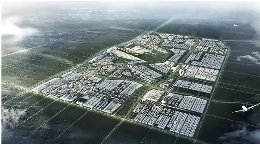
Figura 4 | Zhengzhou Airport Economic Zone, Beijing Tsinghua Planning and Design Institute, 2014.

residenziali; mentre nell'area centrale sono previste industrie (Zhengzhou Municipal Bureau of Urban and Rural Planning, 2018). Sulla base di questo layout, a fine 2018 è stata rilanciata l'azione progettuale bandendo un concorso fra tre design institute cinesi (fig. 4).