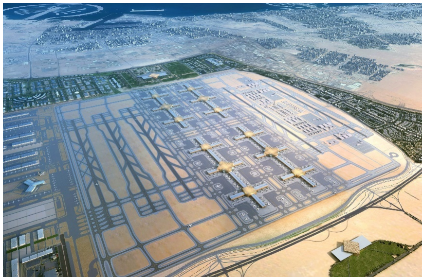
Figura 3 | Dubai World Central e Dubai Logistics Corridor, Leslie Jones Architecture, 2014.