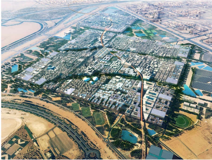
Figura 1 | Masdar Eco-City, Foster + Partners, 2007. Fonte: https://www.fosterandpartners.com

della sustainable division che avrebbe dovuto monitorare il conseguimento degli obiettivi ambientali. Inoltre a partire da febbraio 2010 il progetto non ha più ricevuto alcun sussidio dagli enti governativi. Questo ha portato ad una radicale revisione del piano, con un conseguente ridimensionamento degli obiettivi iniziali (Crot, 2013). Il nuovo progetto ha abbandonato l'ambizione di produrre la totalità del fabbisogno energetico in loco, così come la realizzazione del sistema ecologico per la desalinizzazione delle acque, che ad oggi vengono fornite da un vecchio impianto a gas altamente inquinante. Infine l'avveniristico sistema di trasporti conosciuto come personal rapid transit (PRT), ovvero podcars elettriche che avrebbero dovuto rendere la città car-free, è stato considerato inadatto alle esigenze del luogo. Nonostante tali modifiche al ribasso, ad oggi poco più del 5% dell'intera città è stato realizzato (poco meno di 10 ettari) e vi abitano unicamente i 300 studenti che studiano presso il Masdar Institute of Science and Technology (Williams, 2017).