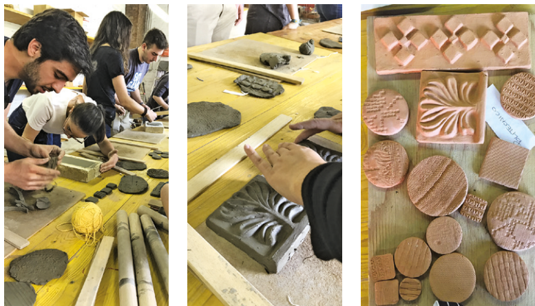
Fig. 01 Esperienze di manipolazione e di riconoscimento di un elemento identitario del luogo: l'argilla.

tutti” ( Design for All ) nei programmi di istruzione e formazione per le professioni interessate” 7 al fine di poter raggiungere gli obiettivi della stessa Convenzione.