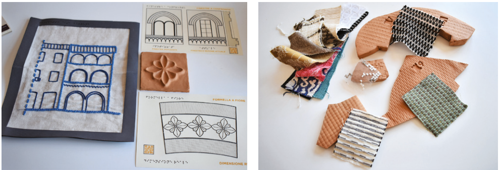
Fig. 02 Uso degli elementi identitari del luogo, l'argilla e il tessuto, per la realizzazione di ausili di mediazione.

vità che l'individuo compie e i nessi che ne derivano, siano finalizzate non solo per se stessi, ma soprattutto verso gli altri. Potremmo quasi dire thinking by doing for all , un apprendimento esperienziale che non si pone come autoreferenziale ma ha come obiettivo il coinvolgimento dei bisogni dell'intera comunità. Fondamentale risulta, quindi, il lavorare in gruppo, con tutti i fattori positivi della socializzazione e del cooperative learning , ad esso correlati. Ciascun componente del gruppo è invitato a compiere azioni in modo attivo e partecipativo, a fare uno sforzo cognitivo nel comprendere i valori sottesi all'azione in un costante confronto con gli altri, a effettuare le scelte sperimentando e facendo sperimentare i conseguenti risultati. Il coinvolgimento all'interno di un gruppo di lavoro di portatori di interessi diversi, non fa che arricchire l'esperienza e potenziare la metodologia di apprendimento.