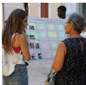
Fig. 2 Incontri del processo partecipato di rigenerazione urbana Santu Vitu Mia (Rielaborazione degli autori, 2020)