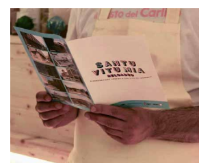
Fig. 3 Promozione del processo partecipativo di rigenerazione urbana Santu Vitu Mia Reloaded (Rielaborazione degli autori, 2020)