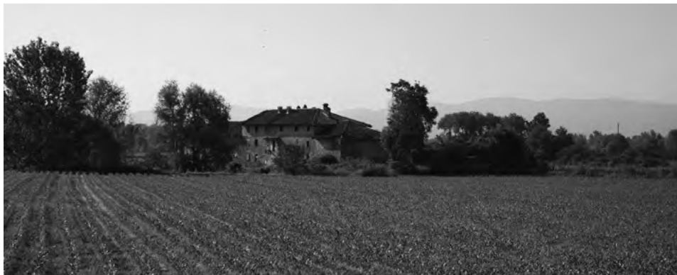
Fig. 5. Scorcio sul paesaggio rurale della zona settentrionale della città: si notino i coltivi che ancora circondano il complesso, nello specifico cascina Lamarmora , che come tante in quest'area patisce gli effetti di un prolungato abbandono.

Fig. 6. Stralcio della Mappa originale del Comune di Torino. ASTO, Riunite, Finanze, Catasti, Catasto Rabbini, Circondario di Torino, Mappe, distribuzione dei fogli di mappa e linea territoriale, Torino, Fig. XVII . Si noti il sistema di canali adiacente ai sistemi architettonici, la coesistenza di ville patrizie e cascine agricole dotate di edifici di culto, la presenza dei viali, demarcati anche da cancellate d'accesso..