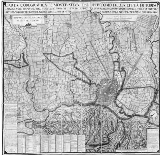
Fig. 1. Carta Corografica dimostrativa del territorio della città di Torino, luoghi e parti confinanti coll'annotazione precisa di tutti gli edifici civili, e rustici, loro denominazione, e titolo de' rispettivi attuali possessori de' medesimi, la designazione, e nome di tutte le strade, e delle principali bealere, e loro diramazioni, incisione di Pietro Amati e Pio Tela, in Giovanni Lorenzo Amedeo GROSSI, Guida alle cascine, e vigne del territorio di Torino e' suoi contorni [...], in Torino, con licenza e privilegio di S.S.R.M., MDCCXC (1790). ASCT, Collezione Simeom, D 1800.