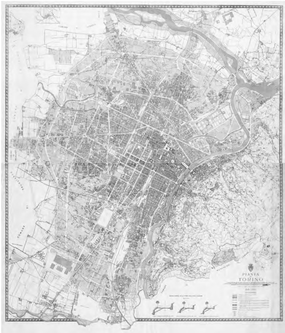
Fig. 4. Servizio Tecnico Municipale dei Lavori Pubblici, Pianta di Torino coll'Indicazione dei due Piani Regolatori e di Ampliamento rispettivamente della Zona Piana [...] e della Zona Collinare [...] aggiornati colle Varianti deliberate successivamente sino a Giugno 1945 (quarta variante piano 1908) . ASCT, Tipi e disegni , 64.8.31/1-2.