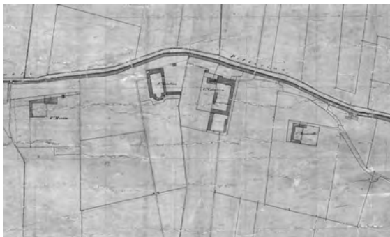
Fig. 6. Stralcio della Mappa originale del Comune di Torino. ASTO, Riunite, Finanze, Catasti, Catasto Rabbini, Circondario di Torino, Mappe, distribuzione dei fogli di mappa e linea territoriale, Torino, Fig. XVII . Si noti il sistema di canali adiacente ai sistemi architettonici, la coesistenza di ville patrizie e cascine agricole dotate di edifici di culto, la presenza dei viali, demarcati anche da cancellate d'accesso..