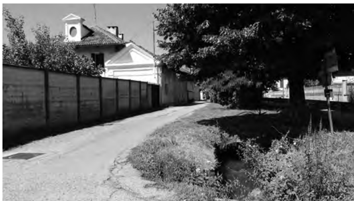
Fig. 10. Lacerti di un esteso sistema irriguo che solo in brevissimi tratti sopravvivono, come nel caso della Gora del Mulino di Villaretto che scorre presso cascina Barberina .