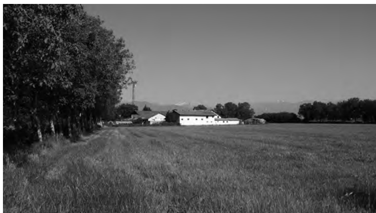
Fig. 9. I lunghi viali alberati di accesso alle cascine costituivano un elemento connotante il paesaggio rurale torinese: un tempo perlopiù costituiti da filari di gelsi, oggi se ne conservano rari casi che, come nella fattispecie della cascina La Nuova Berte , si compongono di tutt'altra specie arborea.