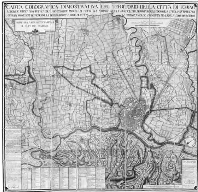
Fig. 1. Carta Corografica dimostrativa del territorio della città di Torino, luoghi e parti confinanti coll'annotazione precisa di tutti gli edifici civili, e rustici, loro denominazione, e titolo de' rispettivi attuali possessori de' medesimi, la designazione, e nome di tutte le strade, e delle principali bealere, e loro diramazioni, incisione di Pietro Amati e Pio Tela, in Giovanni Lorenzo Amedeo GROSSI, Guida alle cascine, e vigne del territorio di Torino e' suoi contorni [...], in Torino, con licenza e privilegio di S.S.R.M., MDCCXC (1790). ASCT, Collezione Simeom, D 1800.