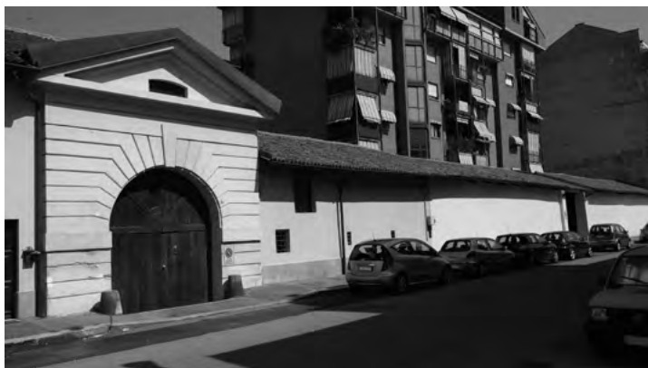
Fig. 8. Uno dei casi di assimilazione dei sistemi rurali all'interno del contesto fortemente urbanizzato; in questo caso la cascina Morozzo , allineandosi agli assi della nuova urbanizzazione del Novecento, è divenuta il patio di accesso di un edificio residenziale multipiano.