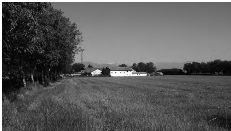
Fig. 9. I lunghi viali alberati di accesso alle cascine costituivano un elemento connotante il paesaggio rurale torinese: un tempo perlopiù costituiti da filari di gelsi, oggi se ne conservano rari casi che, come nella fattispecie della cascina La Nuova Berte , si compongono di tutt'altra specie arborea.