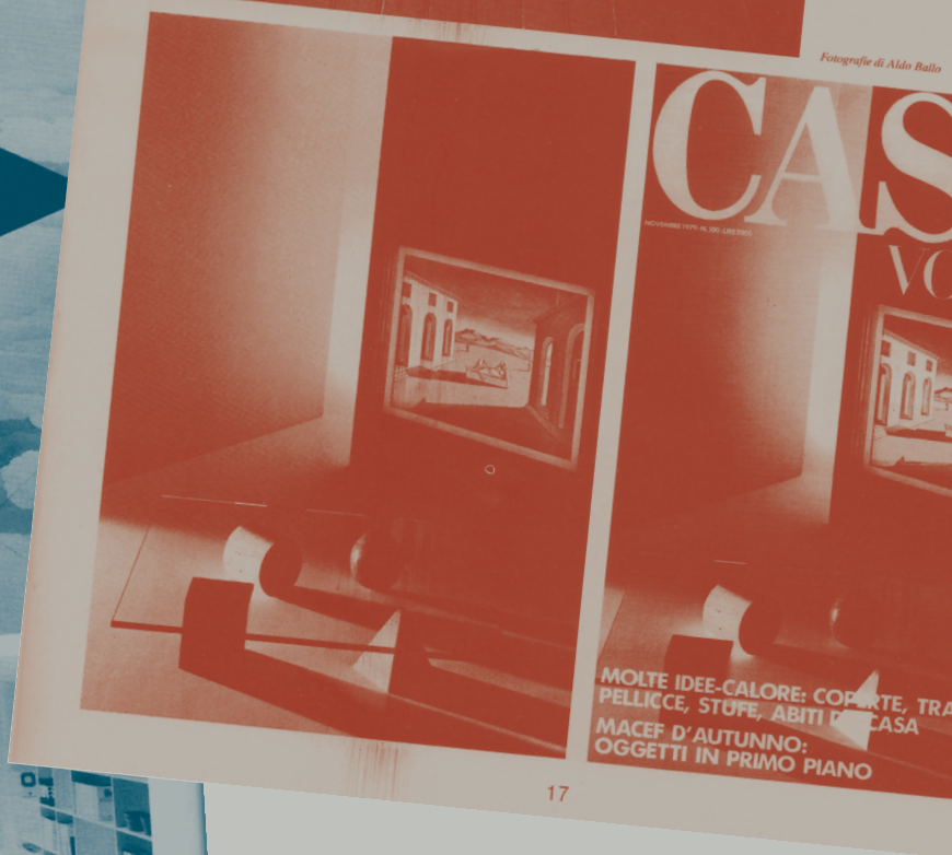
Fotografie di Aldo Ballo

Fotografie di Aldo Ballo e Christopher Broadbent, da Quaderno di fotografia , n. 3, 30 giugno 1979, pp. 16-17.