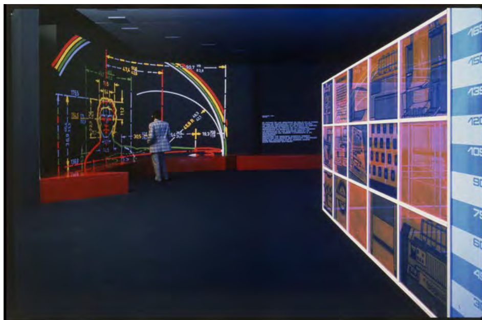
Fig. 4 — G. Colombo, interni della mostra Olivetti Investigación y Diseño , Barcellona, Pabellon Italiano de la Feria de Muestras, 18 febbraio - 6 marzo 1970. Associazione Archivio Storico Olivetti, Ivrea.