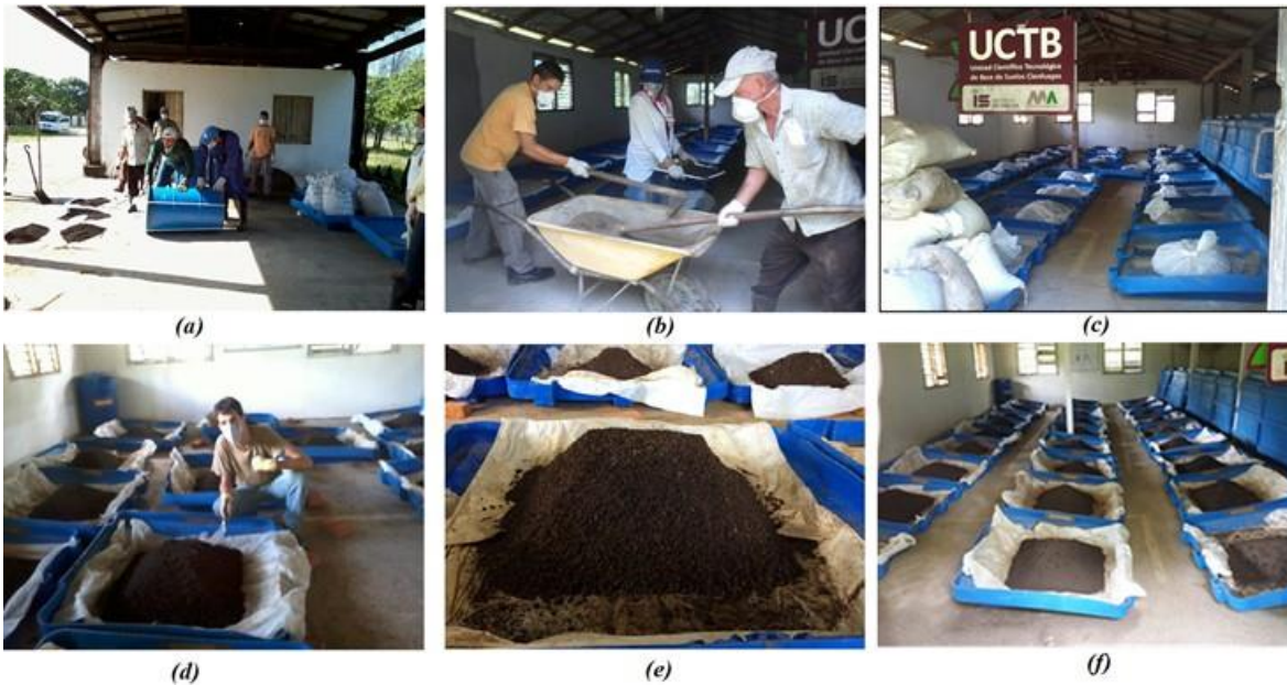
Fig. 3- Imágenes de las etapas de montaje de las unidades experimentales