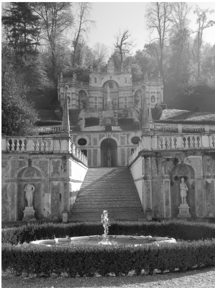
Figura 3. Villa della Regina (Torino). Il giardino superiore: vista della "Catena d'acqua" e del Belvedere.