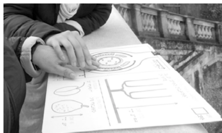
Figura 1. Villa della Regina (Torino). Il giardino superiore: vista della città dal Belvedere. figura 2. Villa della Regina (Torino). Sperimentazione del materiale tattile nel corso di una visita.