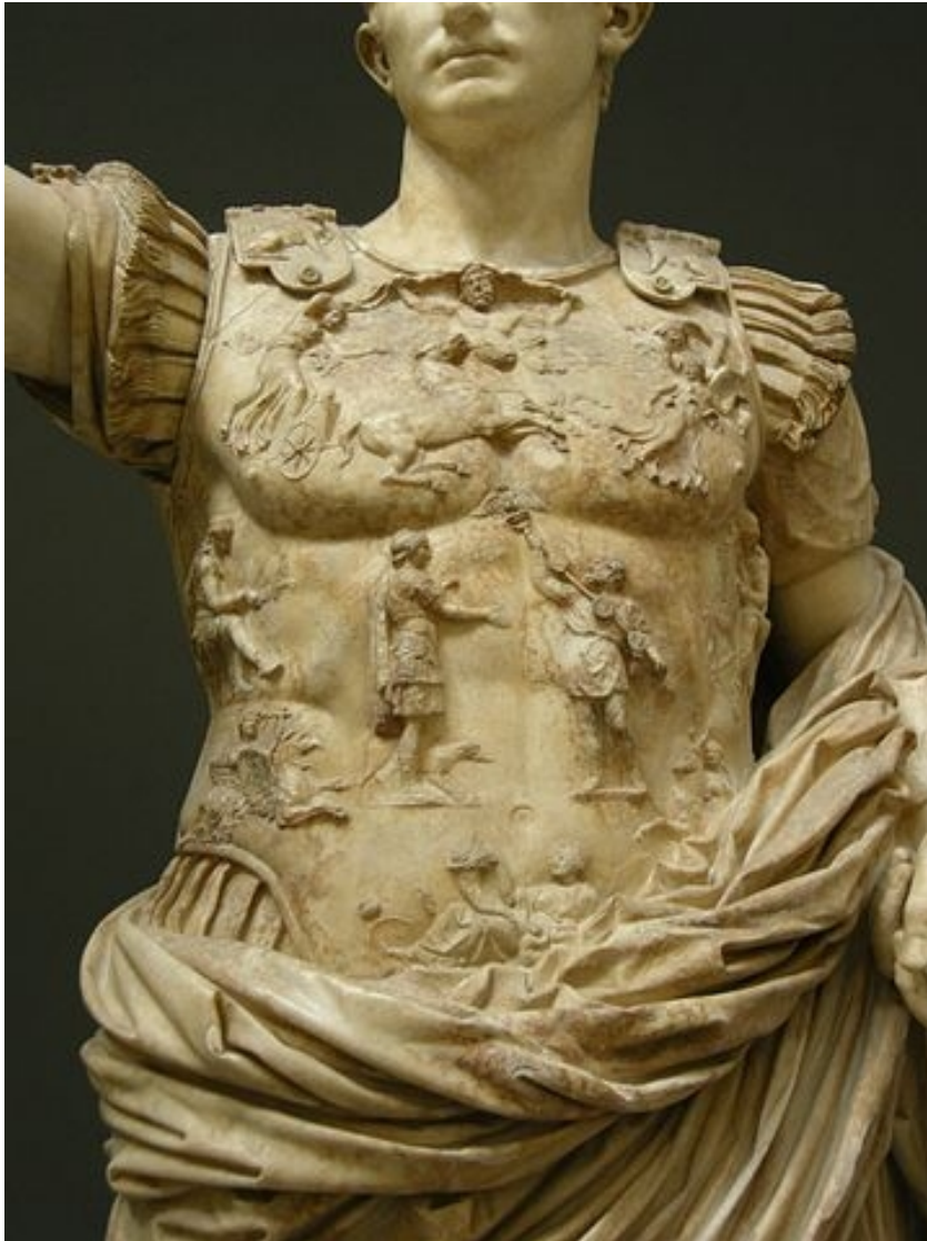
Augustus of Prima Porta statue, now in the Braccio Nuovo of the Vatican Museums, Rome.

Per Augusto, il 23 Settembre era un giorno molto importante, tanto da festeggiarlo con Apollo e un tempio. E il solstizio d'inverno, era importante? Non ci sono dediche relative esplicite.