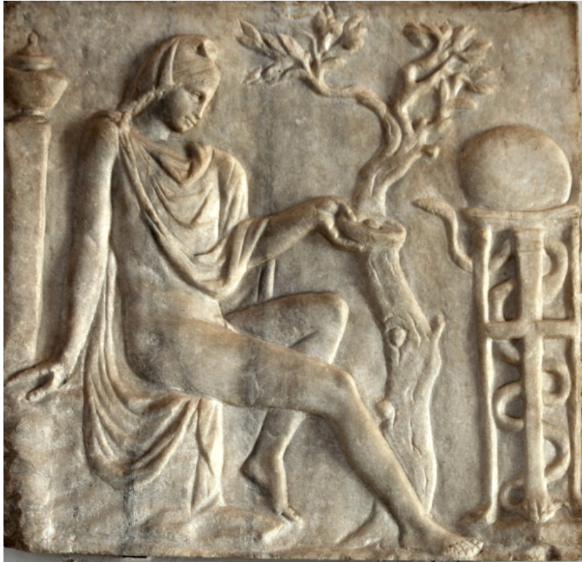
Fianco di sarcofago con raffigurati Apollo e il serpente, metà del II sec. d.C. Ancient Roman relief in the Museo Archeologico Nazionale (Venice)

Nonostante le parole di Svetonio e di Gellio, si potrebbe assumere un modello di concepimento come quello cristiano per l' Annunciazione, con nove mesi prima del Natale in un calendario giuliano solare. La data al 25 Marzo dell'Annunciazione è infatti in relazione al Natale. Tale data è dovuta alla tradizione della Chiesa, mancando al riguardo riferimenti precisi nei Vangeli.