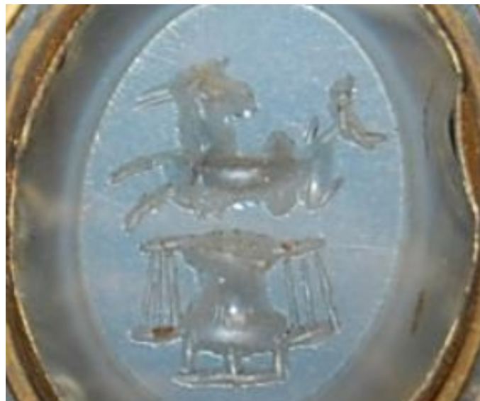
A gem from the Collections of the British Museum (number 1923,0401.329). It is a chalcedony gem engraved with Capricorn and Libra. Roman Imperial period.