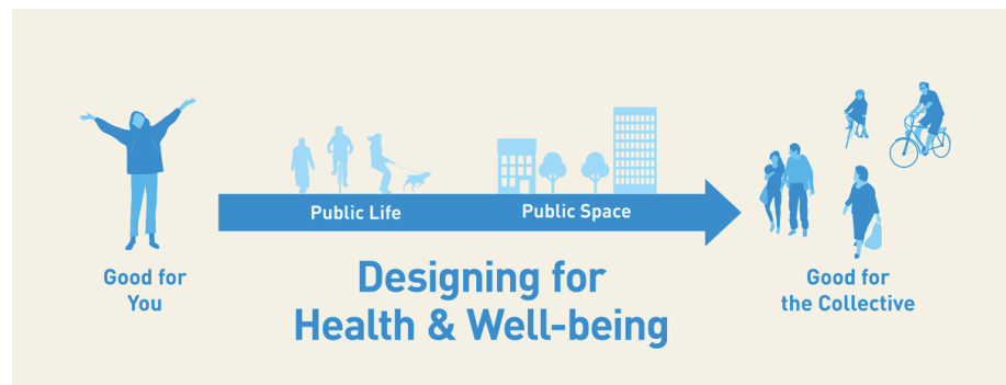
Fig. 4 Good-for-You / Good for Collective. ( https://gehlpeople.com/ ).

Come apparente alternativa potremmo, secondo altri, costruire e usufruire i noti orti urbani, estendere all'infinito la rete delle strade pedonalizzate, andare a scovare spazi vuoti dimenticati e trasformati (a prescindere da un elaborato disegno urbano) in luoghi collettivi, riscoprendo e riproponendo per una volta ancora il consumato paradigma dei playground di Aldo van Eyck.