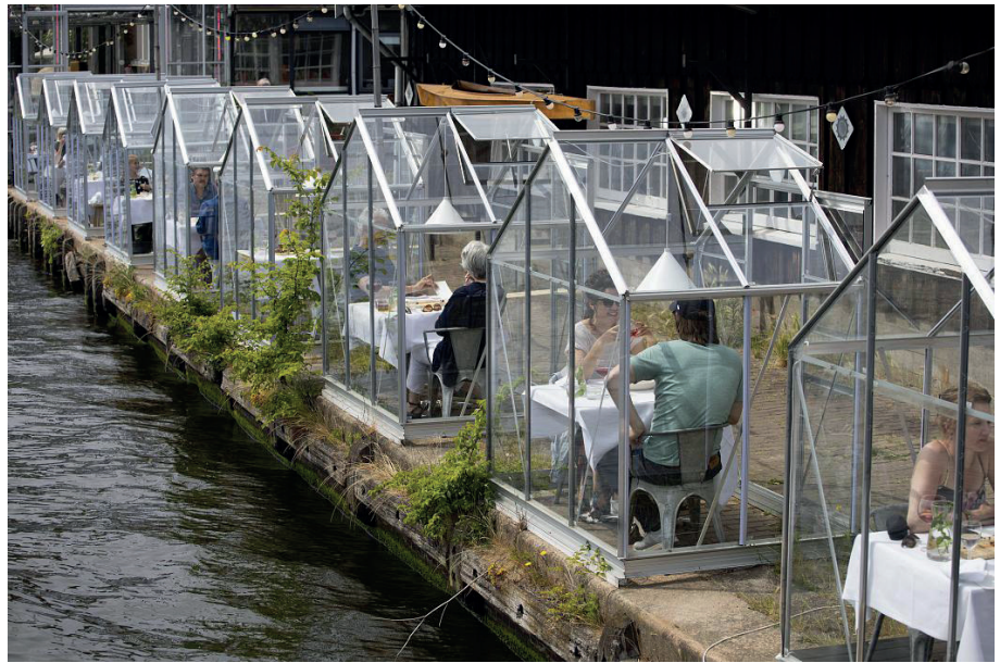
Fig. 5 Restaurant in Amsterdam, after the pandemic, 2020.

«We are uncomfortably adapting to psycho-geographies of isolation. In course we learn new vocabulary, such as “social distancing-compliant building design.” As amenities that were once known as places in the city are transformed now into apps and appliances inside the home, public space is evacuated and the “domestic” sphere becomes its own horizon». (Bratton 2020).