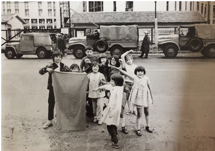
Fig. 5 — Documentazione STRUM sulle manifestazioni per la casa, ph. Paolo Mus-sat Sertor, archivio Derossi.

proposte operative avanzate da un movimento di massa organizzato, in grado di pesare all'interno dello Stato, di esprimere un'autonoma gerarchia di consumi e di imporre modifiche all'intera macchina dell'economia, a partire dai valori d'uso che scaturiscono dalle scelte politiche. Un'analisi corretta di queste posizioni può fornire concreti elementi per valutare la reale possibilità di dare positivo contributo attraverso strumenti disciplinari alla lotta delle classi sfruttate».