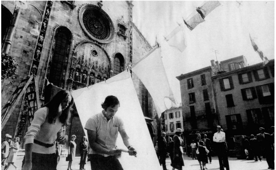
Fig. 3 — Gianni Pettena, Installazione-performance a "Campo Urbano". L'interventi estetici nella dimensione collettiva urbana". Como, 21 settembre 1969 (s.p.).

mi della lotta di classe – e rendere l'università “permeabile” alle tematiche tipiche della società civile, soprattutto delle classi dei lavoratori. Gesto e teoria, utopia e rivoluzione sono state le due parti tra le quali si è svolto il dibattito riflettendo lo slogan “lavoratori e studenti uniti nella lotta” di fronte alle emergenze sociali di Torino nella città e nel suo territorio [12]. Pochi mesi dopo, e in corrispondenza con l’“autunno caldo”, a Como, località scelta probabilmente per la sua posizione periferica rispetto alle piazze più movimentate, si tiene la manifestazione Campo Urbano (Fig. 3), a cura di Luciano Caramel, con la partecipazione di una quarantina di artisti e architetti a fare da connettori di una comunità di cittadini per una serie di Interventi estetici nella dimensione collettiva urbana [13]. Arte performativa e partecipativa, secondo i modelli radicali degli Urboeffimeri [14], dove il valore politico risiede nella “esigenza di portare l'artista a diretto contatto con la collettività di un centro urbano, con gli spazi in cui essa quotidianamente vive, con le sue abitudini, le sue necessità” [15].