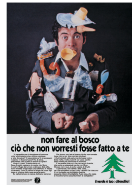
Fig. 7 — Pubblicità Progresso boschi puliti “Il verde è tuo difendilo”, Agency: ATA-UNIVAS, production: R.P.A.

In conclusione, lungo due decenni di confronto continuo con idee e azioni, di necessità quasi irrinunciabile di scegliere, se non dichiarare, il grado di engagement che spesso sfocia in vere e proprie militanze – o astensioni – politiche, si verifica per i progettisti italiani una replica – variata – di quanto già accaduto prima della guerra e registrato da Antonio Gramsci: l'intellettuale, e nel nostro caso il progettista, si trasforma da creatore a organizzatore [41].