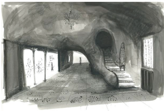
Figura 1. Morbelli, case a Capri, interno. Ridiseño: GB

Le due case a Capri, progettate nel 1942 e non realizzate, incarnano il concetto di casa mediterranea, che Morbelli aveva già sperimentato nelle prime case nelle campagne alessandrine e il cui interesse è testimoniato anche dalla raccolta di copie di disegni di scorci di Capri (1926-28) e dai disegni di viaggio che Morbelli redige di sua mano a Capri, uno dei quali è datato 1940. Il tema progettuale, commissionato dal dottor Peisino, è risolto con una composizione di volumi compatti che si innestano nel terreno scosceso attraverso il raccordo con muri sinuosi che legano gli edifici all'ambiente circostante.