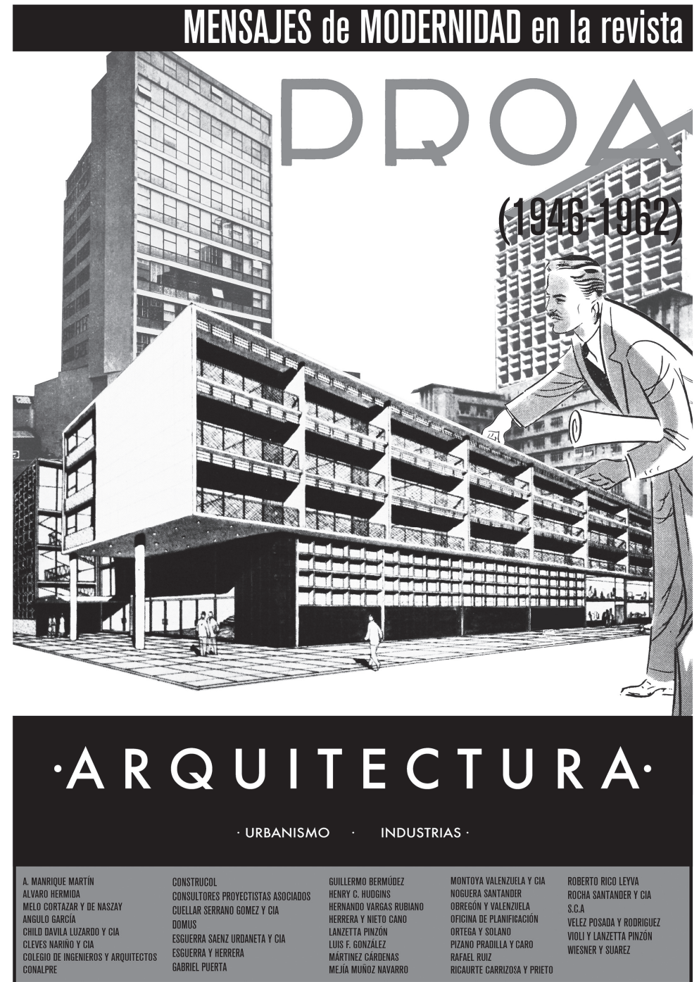
Fig 2. Imagen resumen de publicidades de arquitectos en revista Proa , Colombia, 1946-1962. Fuente: elaboración propia