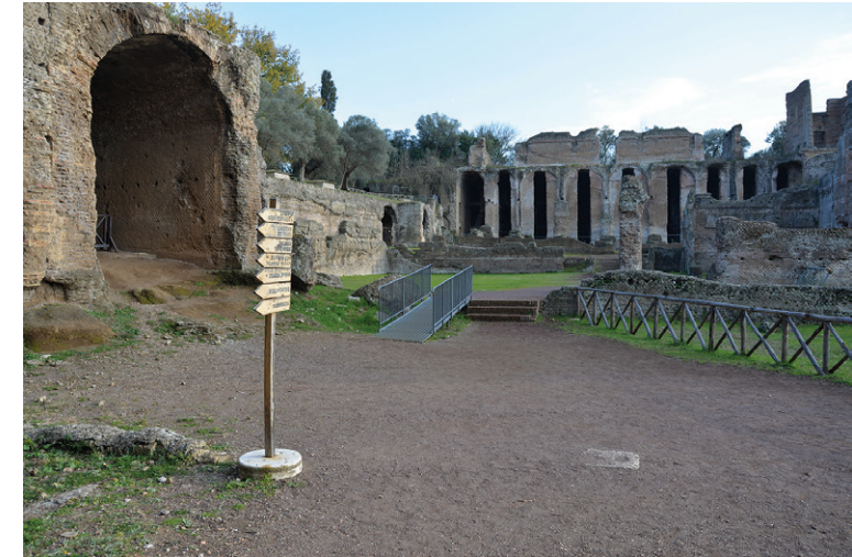
Fig. 04 Area delle Grandi Terme, Scale e rampe. F. Scialdone, 2019

intellettive consultabile sul sito web. La comunicazione, quindi, e non solo gli interventi di adeguamento, deve rientrare in un progetto di miglioramento delle condizioni di fruibilità per tutti.