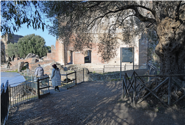
Fig. 03 Area Terme con Heliocaminus, Dettagli parapetti e passerella. F. Scialdone, 2019

gamenti bus non arrivano all'ingresso del parco, ma si fermano a una distanza di circa 300-1000 metri. I percorsi pedonali di avvicinamento al sito archeologico presentano altre criticità: dalla mancanza di un'adeguata segnaletica che dalla fermata dei mezzi pubblici permetta di raggiungere l'ingresso della Villa, al pessimo stato di conservazione del sedime stradale e dei marciapiedi, alla sezione ridotta degli stessi con l'aggravio di dislivelli continui che rendono particolarmente faticoso il percorso pedonale di avvicinamento al sito.