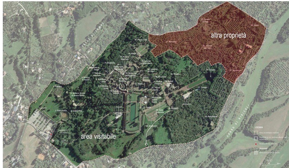
Fig. 01 Il parco archeologico di Villa Adriana, Inquadramento planimetrico. E. Guaitoli, G. Pedavoli, 2017

I primi studi sono stati di metodo e di analisi: un primo approccio all'individuazione delle principali questioni connesse allo stato attuale dell'accessibilità al complesso di Villa Adriana 8 . Un confronto tra lo stato dell'arte del sito archeologico tiburtino e i principali siti archeologici italiani ha consentito di mettere a confronto le tipicità dei diversi luoghi: la localizzazione rispetto al centro abitato, l'estensione del sito, la caratterizzazione della componente naturalistica, la struttura dei percorsi e dei servizi offerti al visitatore, l'individuazione di percorsi e ingressi accessibili, gli interventi di miglioramento della fruizione in corso o già realizzati. Su queste stesse categorie si è mossa una prima fase di analisi sullo stato di fatto della villa, entrando quindi nel merito delle criticità e problemi aperti.