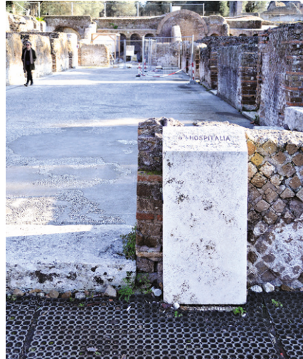
Fig. 05 Area degli Hospitalia, Cippo di segnalazione (L. Ghetti) e protezione in gomma dei pavimenti mosaicati. F. Scialdone, 2019

presenza di tratti con eccessiva pendenza non risolti e l'assenza di dispositivi alternativi per il superamento dei grandi dislivelli. Questa profonda eterogeneità si evidenzia anche nell'ampia casistica di esempi di parapetti e protezioni per scale, delimitazione di aree, di fondi e pavimenti 12 , tutti elementi che contribuiscono a generare un senso di discontinuità che può creare nel visitatore un certo senso di disorientamento. Non sfugge a questo carattere disomogeneo anche il più ampio tema della segnaletica: spesso non coerente o superata rispetto alle informazioni indicate nei percorsi ufficiali, carente nell'indicare attrezzature presenti a servizio del visitatore o di segnalazione circa la durata e la lunghezza dei percorsi di visita (Fig. 04). Le tipologie stesse della segnaletica sono varie e non seguono un progetto unitario.