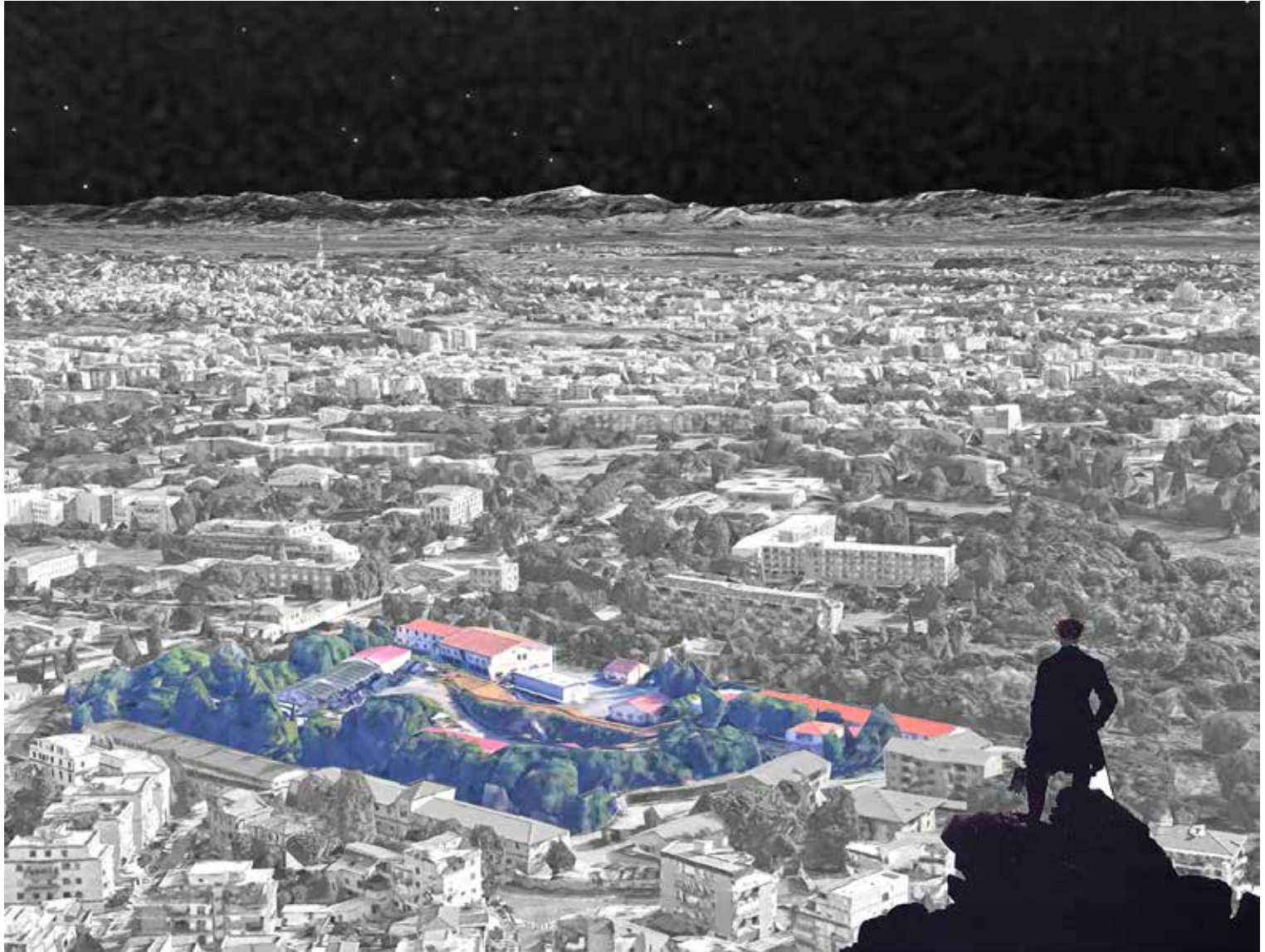
La complessità del paesaggio urbano di Forte Aurelia (elaborazione grafica di P. Mellano).