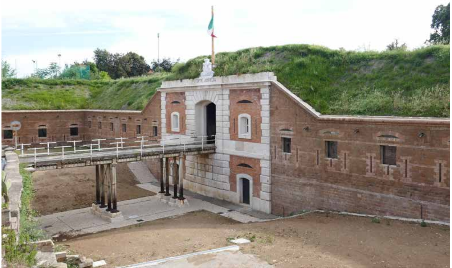
Forte Aurelia, il fronte di gola dopo lo scavo del fossato e il restauro del prospetto (F. Meneghelli, 2019).