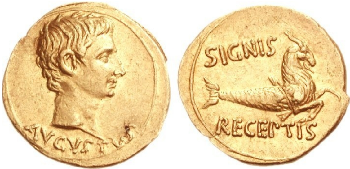
Augusto. 27 a.C.-14 d.C. - AV Aureo (7.74 g, 6h). . zecca di Pergamo. Coniata 19 a.C. AVGVSTVS, testa nuda dx SIGNIS sopra, RECEPTIS sotto, capricorno dx - RIC I 521; Calicó 272 (this coin illustrated); BMCRE 680 = BMCRR East 298; BN 976, 979-980.