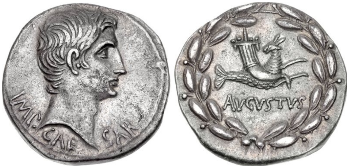
Augusto. 27 a.C.-14 d.C. AR Cistoforo (25mm, 12.04 g, 12h). zecca di Efeso. Coniata circa 25-20 a.C. IMP CAE SAR Testa nuda dx AVGVSTVS Capricorno a destra, testa ruotata a sinistra; porta una cornucopia sulla schiena, il tutto entro corona di alloro. RIC I 480; Sutherland Group VI \alpha (unlisted dies); RPC I 2213; RSC 16.