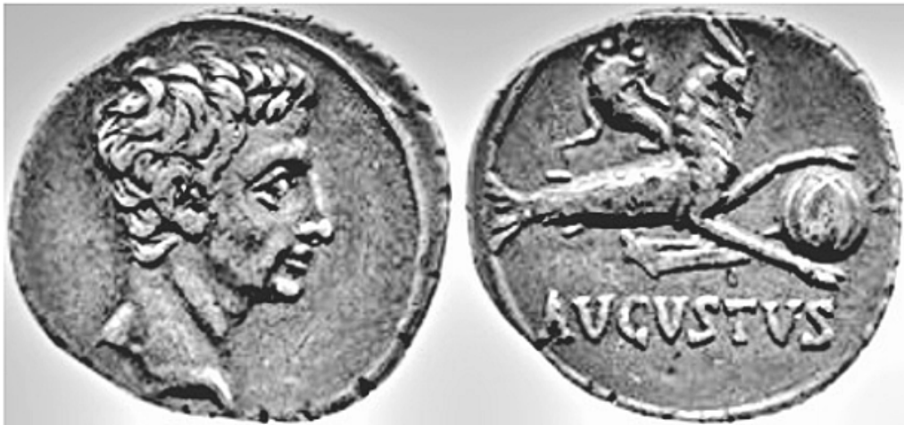
Moneta al British Museum.

Magnus gubernator et scisso navigat velo et, si exarmavit, tamen reliquias navigii aptat ad cursum