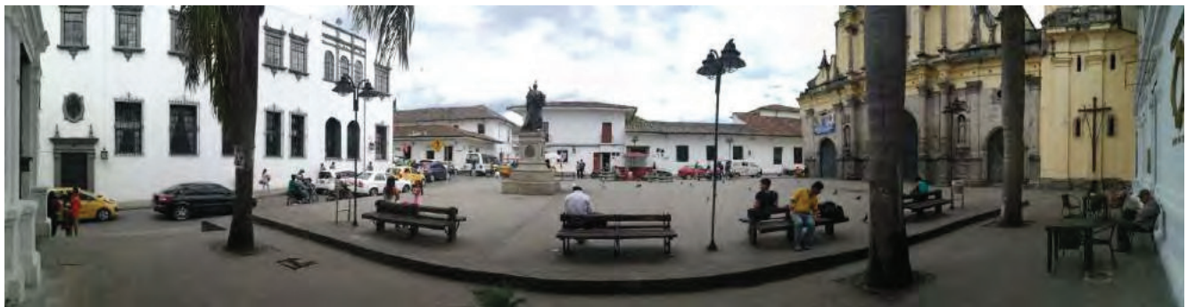
1: Lo slargo tra la Calle 4 e la Carrera 9 A, chiamata informalmente Plazoleta San Francisco, di fronte il quale passano le processioni della Semana Santa.

Le Processioni della Settimana Santa a Popayán – che si tengono dal martedì al sabato precedenti la Pasqua – sono una tra le tradizioni colombiane praticate senza soluzione di continuità dall'epoca coloniale all'attualità, e seguono un percorso codificato che si snoda per due chilometri attraverso il centro della città 3 . Tra le motivazioni determinanti che ne hanno sancito il riconoscimento UNESCO emerge il fatto che queste manifestazioni, che attirano visitatori da tutto il mondo, «are a major factor contributing to social cohesion and the local collective psyche» 4 ; tale affermazione, a nostro parere, sollecita alcune riflessioni legate in particolare alla percezione socio-identitaria degli spazi urbani da parte dei nuovi – in virtù di flussi migratori o per motivi anagrafici – abitanti della città.