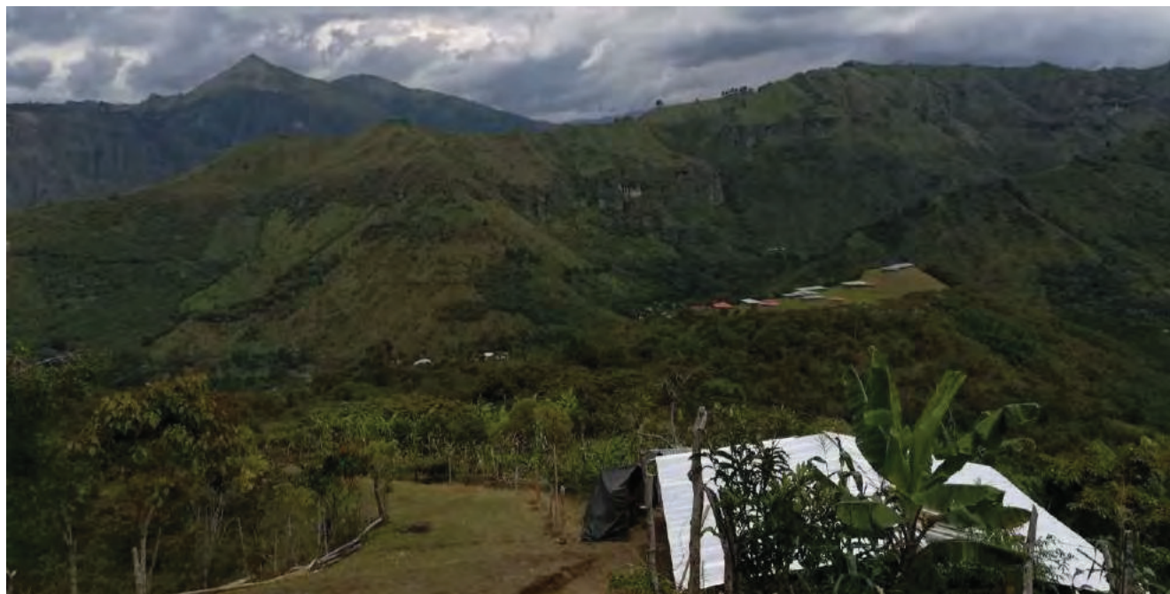
5: Nell'immagine – scattata il 31 luglio 2017 – si vedono, in primo piano e sullo sfondo, le strutture di copertura degli scavi archeologici che spiccano sul paesaggio andino.