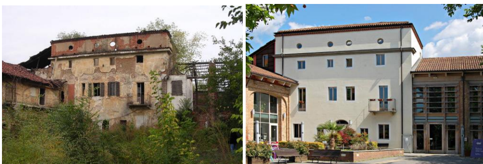
Fig. 2 – Cortile interno cascina Roccafranca anni 60 e 2017