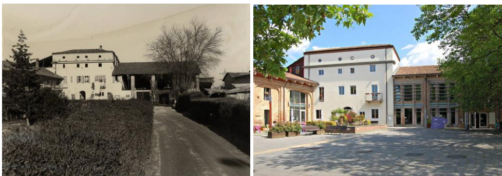
Fig. 1 – Cascina Roccafranca anni 60 e 2017

attraverso i Fondi strutturali, con lo scopo di promuovere strategie innovative per la rivitalizzazione socioeconomica dei centri urbani medio-piccoli o di quartieri degradati delle grandi città. Urban 2 del Comune di Torino, i cui interventi si sono conclusi a dicembre del 2009, ha finanziato interventi volti a rilanciare lo sviluppo e a migliorare la qualità della vita nel quartiere Mirafiori Nord. L'edificio della cascina Roccafranca, vincolato a destinazione d'uso sociale, fu giudicato di interesse da parte dell'amministrazione all'interno del programma a causa della sua posizione, strategica per la creazione di nuove centralità nel quartiere (Fig. 1) (Fig. 2).