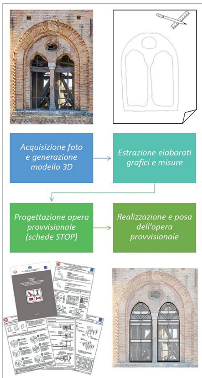
Figura 5. Sequenza figurata che illustra il workflow studiato per la realizzazione di opere provvisoriale con garanzia di maggior sicurezza per gli operatori VVF.