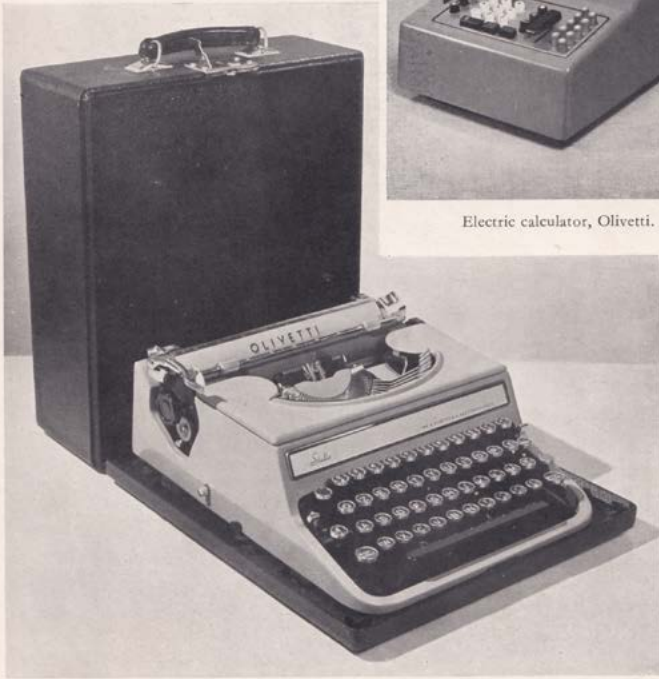
Portable typewriter, Olivetti.