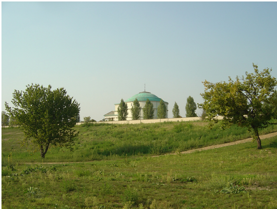
(Fig. 8) Il Mausoleo della Bela Rosin visto dal parco del Sangone – The Closure Library Authors License Apache-2.0.