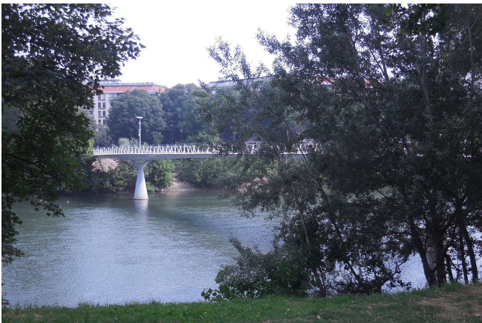
(Fig. 3) Lungo Po, sponda destra, nell'area del Parco Michelotti (ex Zoo) – Foto Paola Gregory.

Partendo dalla ricchezza paesaggistica e storica, dalle sue potenzialità e vulnerabilità, il progetto Corona Verde , che coincide nel capoluogo con il piano Torino città d'acque (Acer 2001), mira a realizzare un nuovo assetto dell'area metropolitana, affiancando al processo di riconversione economica e industriale quello della ricostruzione degli equilibri ambientali, attuata attraverso la valorizzazione delle risorse che, in questo senso, caratterizzano il territorio e ne definiscono una precisa identità (Fig. 3).