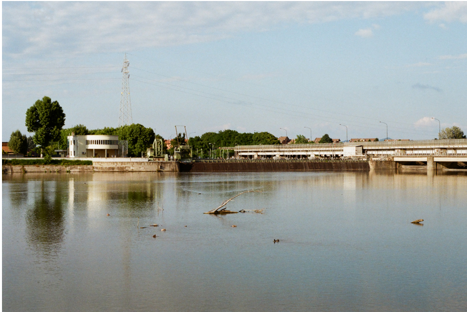
(Fig. 7) Il Po: Ponte-diga e centrale idroelettrica dal parco del Meisino – Foto di Domenico Fontana.