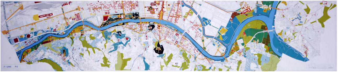
(Fig. 5b) Masterplan Torino Città d'Acque (tavola della fascia fluviale del Po). Progetto elaborato dagli architetti Maurizio Zucca e Maurizio Cilli.

Il progetto, che è riuscito a convogliare su di esso le risorse dei 'grandi eventi' (i giochi olimpici invernali del 2006 e il 150° anniversario dell'Unità d'Italia nel 2011) ha visto implementare la continuità e connettività del sistema verde, favorendo la fruizione dei parchi e la mobilità sostenibile, che dal 1990 al 2016 "è aumentata di oltre il 500%" (Cassatella 2016): a metà degli anni'90, quando è stato avviato il progetto, "le sponde dei fiumi torinesi erano percorribili al 30-35%, oggi lo sono per circa l'80%"; lungo le sponde del Po i percorsi ciclo-pedonali hanno raggiunto il 95%, mentre tasselli mancanti riguardano principalmente la Stura e il Sangone (Centro Einaudi, 2019).