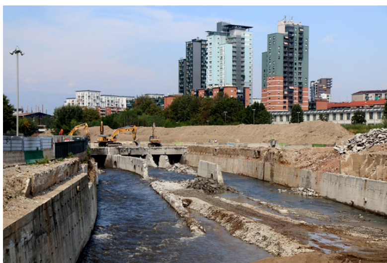
(Fig. 2) Lavori di stombatura della Dora Riparia, agosto 2017 – Città di Torino, Circoscrizione 4, sopralluogo.

Lungo i fiumi si sono articolati nel tempo importanti episodi storico-architettonici, urbanistici e paesaggistici: a partire dalla cosiddetta Corona di Delizie 1 – espressione coniata in età barocca per designare il complesso di palazzi, vigne, ville e castelli destinato al soggiorno e allo svago della dinastia sabauda – agli importanti interventi ottocenteschi – quali il sistema di Piazza Vittorio Veneto-Gran Madre di Dio, i tratti di lungofiume edificati come i Murazzi, lo storico parco del Valentino – sino ai grandi parchi fluviali dell’epoca moderna, i fiumi hanno sempre avuto un ruolo importante per i cittadini, almeno fino agli anni’50 del XX secolo, quando, nascosti dalle industrie della “città-fabbrica” per antonomasia, inglobati dall’espansione edilizia del dopoguerra, costretti a scorrere lungo gli argini – se non in parte intombati come la Dora - sono divenuti estranei alla vita della città e percepiti come realtà frammentarie, con un conseguente “indebolimento del [loro] ruolo simbolico [...] nell’immaginario collettivo” (Cassatella, 2004) (Fig. 2).