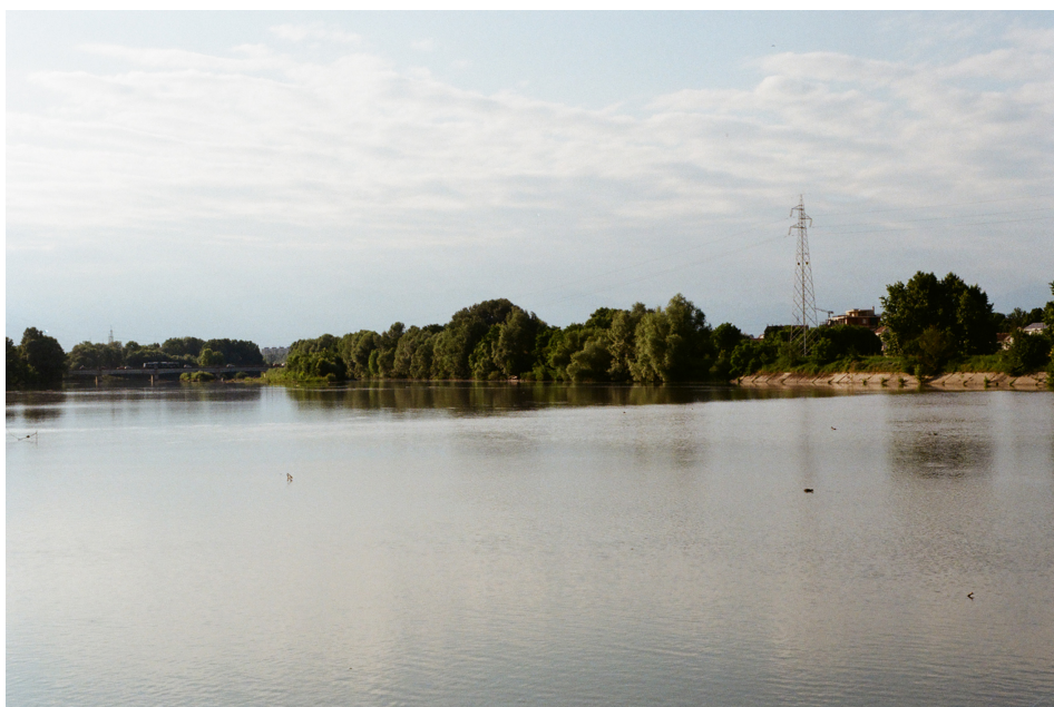
(Fig. 6) Confluenza tra i fiumi Po e Stura di Lanzo dal parco del Meisino – Foto di Domenico Fontana.