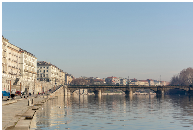
(Fig. 1) Il Po nell'area centrale di Torino con gli storici Murazzi.

Situata lungo il fiume Po fra le Alpi e le colline del Po, in un'area nominata nel 2016 dall'UNESCO Man and Biosphere Reserve quale esempio virtuoso di rapporto uomo-ambiente, la città di Torino ha sempre avuto un legame strutturale con i propri fiumi: insieme al Po, gli affluenti Dora Riparia, Stura di Lanzo e Sangone (per un tot. di 40,1 km di tratti urbani) hanno rappresentato per la capitale sabauda prima e per il capoluogo piemontese in seguito, precisi assi strategici di riferimento e sviluppo (fig. 1).