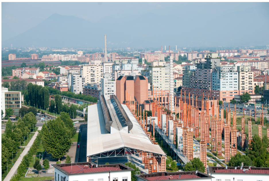
(Fig. 9) Latz+Partner, Parco Dora, lotto Vitali – licensed under the Creative Commons.

A tutt'oggi restano ancora da completare alcuni tasselli del piano generale, conseguenza di un forte rallentamento nel secondo decennio del Duemila, dovuto non solo alla crisi economica globale, ma anche agli ostacoli che si interpongono alle realizzazioni. Fra gli altri: problemi di natura idraulica, necessità di ingenti opere di bonifica (come nel caso dell'area Basse di Stura, usata per decenni come "parco scorie" dal dissennato sviluppo industriale), frammentazione della proprietà.