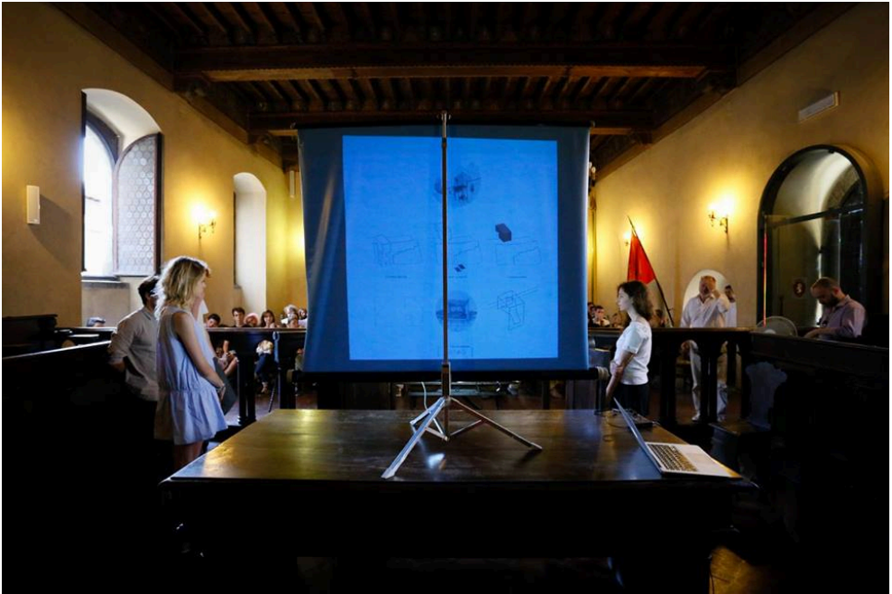
Fig. 8 Presentación final de un grupo. Comune di Cortona (Cortona).