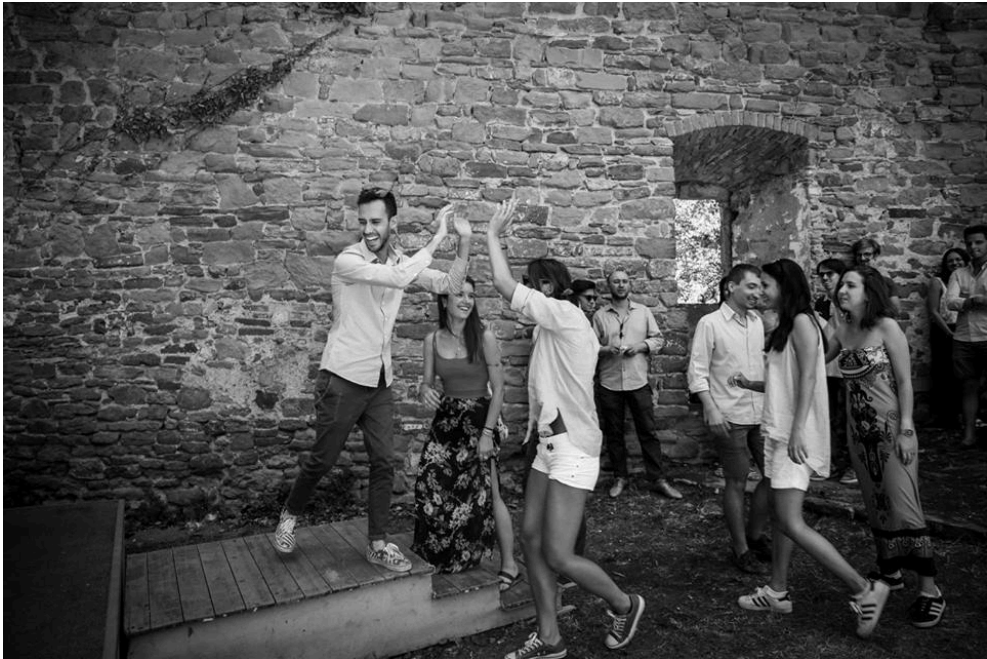
Fig. 10. Premiación final. Fortaleza del Girifalco (Cortona).