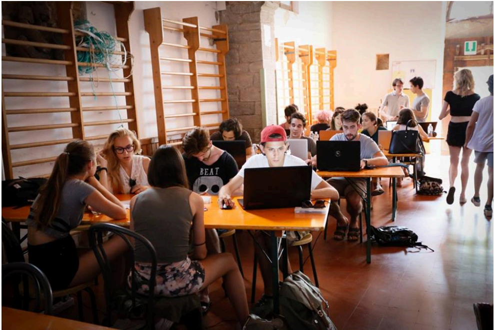
Fig. 3 Estudiantes trabajando en la iglesia de San Sebastiano (Cortona).