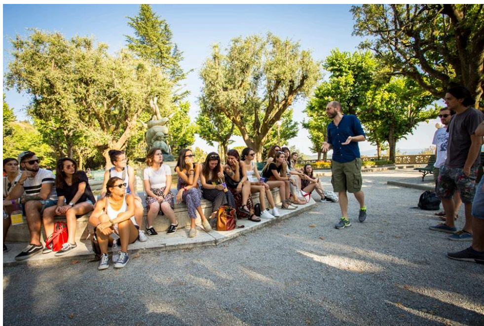
Fig. 5. Lecciones frontales en el Parterre (Cortona).

El programa del curso inicial de software que los alumnos realizan mientras debaten en grupo las ideas del proyecto es el siguiente: