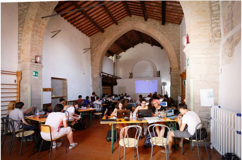
Fig. 4 Estudiantes trabajando en la iglesia de San Sebastiano (Cortona). Fotografía de los autores