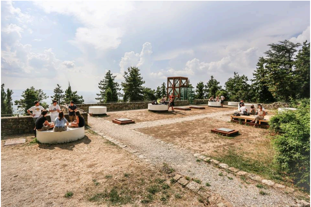
Fig. 1 Estudiantes trabajando en la Fortaleza del Girifalco (Cortona)- Fotografía de los autores