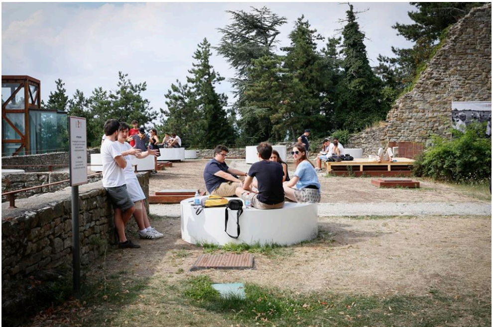
Fig. 2 Estudiantes trabajando en la Fortaleza del Girifalco (Cortona).

El objetivo principal del workshop es por tanto aprender a utilizar el software de diseño tridimensional de una forma diferente y mucho más eficaz a la habitual retahíla de comandos y ejercicios anodinos en la que se convierten la mayor parte de estos cursos que