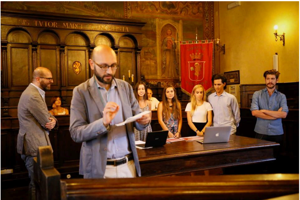
Fig. 9 Premiación final. Comune di Cortona (Cortona). Fotografía de los autores