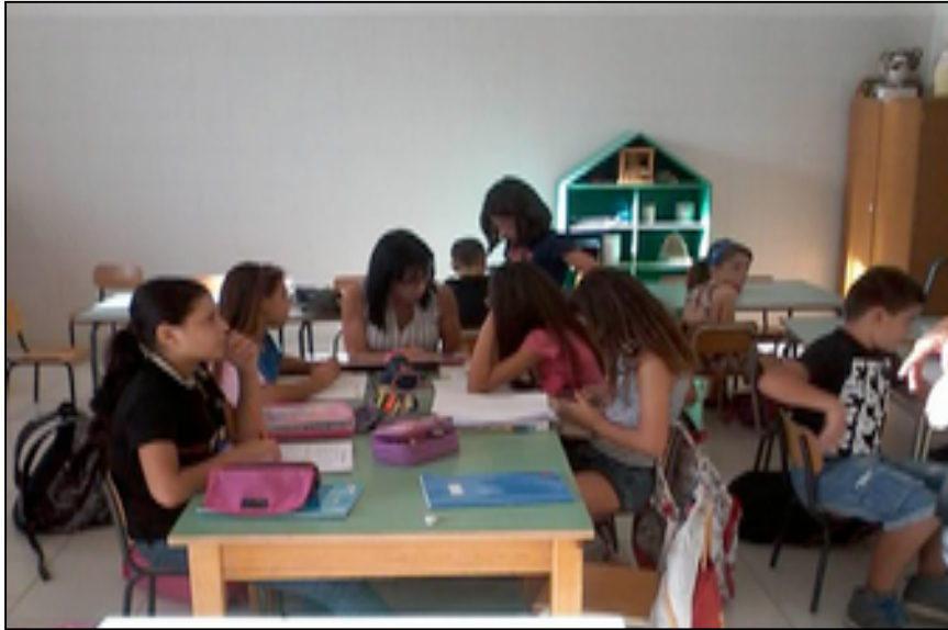
Figura 4. L'interno della struttura durante un pomeriggio dedicato alle attività didattiche.

Nonostante l'accordo finale e i forti contatti tra associazione e alcuni consiglieri comunali della precedente giunta, anche a Sant'Elia rimane forte l'opposizione (almeno manifesta) contro l'amministrazione cittadina accusata di aver abbandonato il quartiere e, soprattutto, di non supportare l'azione di rinnovamento sociale avviato dall'associazione: