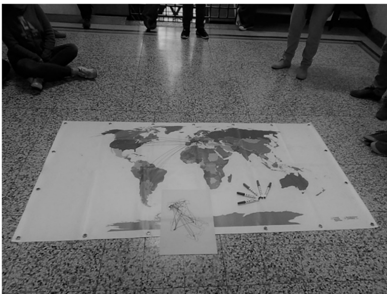
Figura 4 – Carta che raccoglie le rotte migratorie personali. Foto di Silvia Aru, 2017.