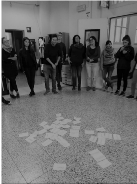
Figura 2 – Partecipanti durante l’attività “Quando sento la parola migrazione penso a...” descritta nel paragrafo 2.1.