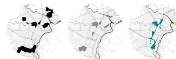
02. La mappa principale rappresenta la sovrapposizione delle tre fasi principali, secondo l'autore del testo, di trasformazione della città: Addizione (fase di sviluppo fordista tra gli anni '40 a '70 del secolo scorso), Sottrazione (fase di dismissione dovuta principalmente alla crisi del settore industriale tra gli anni '80 e i primi anni del nuovo secolo) Polarizzazione (processo iniziato con l'approvazione del PRGC del 1995 ad opera di Gregotti e Cagnardi e portato a compimento nel 2011 circa). In basso le tre fasi scorperate. Questa immagine evidenzia come nel corso dell'ultimo secolo la città, per ricostruire la propria immagine abbia insistito sempre sulle stesse parti di territorio.