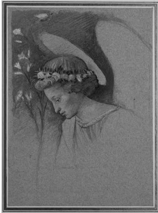
Fig. 4 Ruskin, Iris Florentina (1875, disegno acquerellato, Oxford, John Ruskin Teaching Collection, Ashmolean Museum).