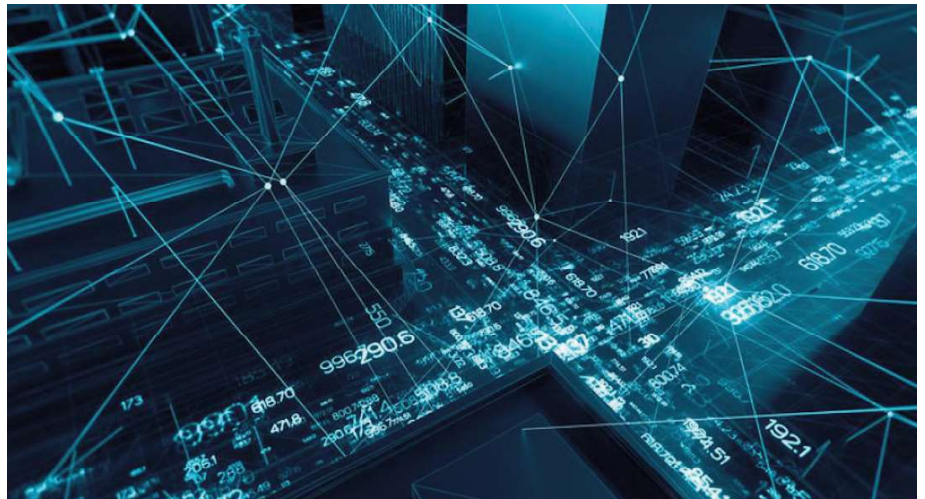
Il futuro e la realtà aumentata The future of augmented reality