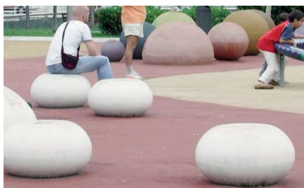
Fig. 5 - Monolith urban furniture benches made of concrete containing fine aggregates and with superficial etching and waterproof finishing: colour variation, slight patina in lower area (operating life: 4 years); Parco Nervion, Abandoibarra, Bilbao (credit: R. Maspoli, 2006).

La catena di neoartigianato si esplicita con l'indirizzo di marketing strategy a settori di nicchia, ma la prospettiva è di mass customization, inteso come approccio produttivo-commerciale che si fonda sulla capacità di un processo integrato di offrire prodotti e servizi personalizzati a costi confrontabili rispetto alla produzione standard. Il concetto di atelier tecnologico-digitale del cemento per la produzione on demand e a serie snella deve avvalersi di filiere di supply chain crescenti (Noche and Tarek, 2013). La domanda in Italia è ancora limitata, malgrado la presenza di una rilevante tradizione artigiana – in evoluzione dalla tipologia tradizionale del cementista – e l'innovazione tecnologica ha impatto inferiore rispetto ai mercati di Francia, Germania e Svizzera. In tali mercati, processi di produzione per getto di UHPC in impianti automatizzati e industrializzati sono già sperimentati per i pannelli di rivestimento dell'involucro, raggiungendo prezzi di fornitura competitivi rispetto alla pietra e altri materiali di alta gamma. Inoltre, facilità e velocità di installazione e trasportabilità possono ulteriormente contribuire al risparmio complessivo (Henry and Heaney, 2017).