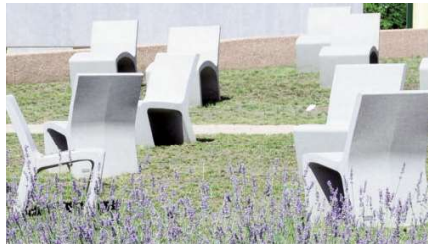
Fig. 9 - Sicurta, manufactured by Escofet. Urban furniture benches made of self-compacting thin-section reinforced concrete, with waterproof finishing: colour variation, patina in lower area, local staining (operating life: 8 years); Parco Belisario, Turin.

as granite, an extremely low permeability to aggressive external agents (water, particulates, and other forms of air pollution), and high ductility in the eventual post-cracking behaviour. 'Molecular concrete' is at the basis of Metalco's Italian supply/production chain in the urban design field; it produces thin-section open or closed profile elements, such as the AIR bench boasting a 25-mm thickness (Fig. 12). The effectiveness and efficiency of its process is based upon the interaction between research and manufacturing, with the internalization of the entire technology cycle from mix-design to urban design: manufacture of the moulds, component testing, engineering, casting and finishing. The company has also promoted development of Ultratense Concrete, a mix design that may be defined as highly ductile and free-flowing, which facilitates performance and favours the addition of mineral-based pigments (Fig. 13).