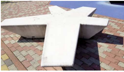
Fig. 8 - Flor, manufactured by Escofet. Playground furniture made of self-compacting reinforced concrete with acid-etched waterproof finishing: colour variation, patina in lower area, staining, and local graffiti (operating life: 4 years); Parco Mennea, Turin.