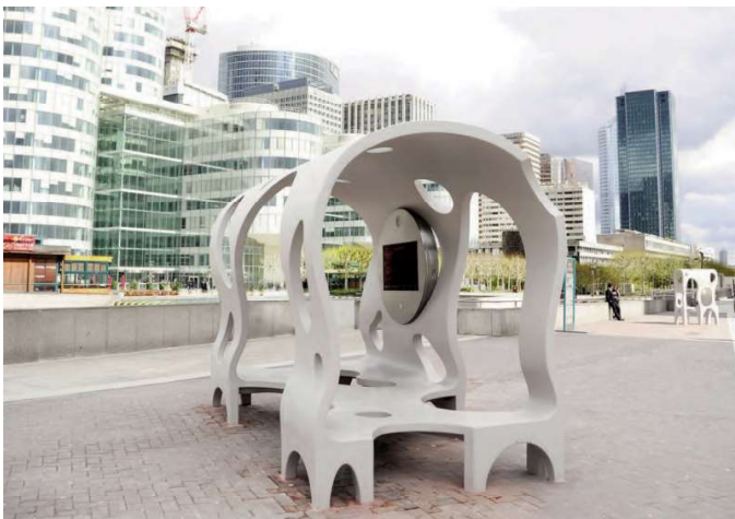
Fig. 16-18 - Stanzas, La Défense Urban Furniture Biennial, manufactured by escofet: urban furniture structure made of self-compacting thin-section reinforced UHPC.