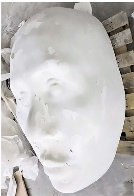
Fig. 1, 2 - Flowstone, UHPC, public art: Priming and preparation of the mould; Formwork surface unfinished (credits: R. Maspoli, 2015).

funzione di additivi ed elasticità delle casseforme. Negli interventi legati a elementi perimetrali d'involucro e di urban furniture è, quindi, essenziale l'impiego di superfluidificanti e anti-ritiro.