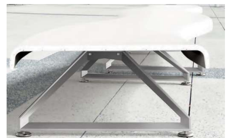
Fig. 10 - Nanodur, urban furniture bench made of UHPC: colour variation, uniform patina, carbonation (operating life: 4 years); Parco Mennea, Turin.