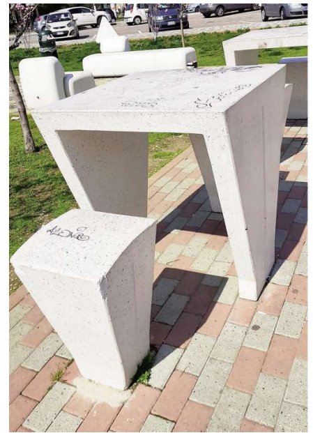
Fig. 7 - Urban furniture stools and tables made of self-compacting concrete and polished artificial stone: colour variation, local staining and graffiti (operating life: 4 years); Parco Mennea, Turin.

Throughout a 4-year monitoring of public art and urban design elements – made of traditional concrete, coated or uncoated, and UHPC mixes – it has been recorded how UHPC suffered local soiling due to the effect of atmospheric agents and pollutants. This was mostly avoided through self-cleaning processes and a limited patina formation (Figs. 3, 4). Aging patina presented slight chromatic alterations in limited areas, without the formation of efflorescence and surface cracking. In comparison, traditional concrete elements present a swifter formation of stains and chromatic alterations, as well as less abrasion and impact resistance 2 . In case of colour additives applied to the paste, different colours present different performance in terms of UV-resistance and stability: discolouration caused by the action of UV rays and superficial carbonation appears to be limited for dark pigments – especially black and red, based on iron oxides (Figg. 5-11). The main criticality