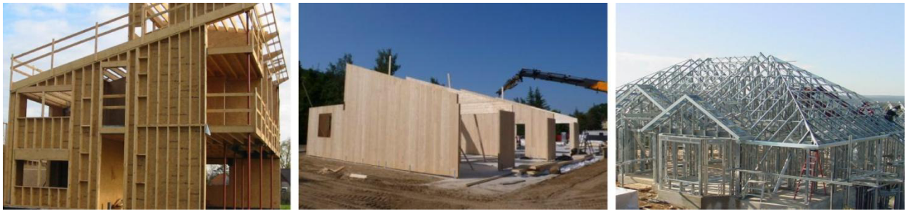
Figura 1. Metodologie di costruzione a secco: sistema balloon frame; sistema a pannelli Xlam; sistema steel frame.