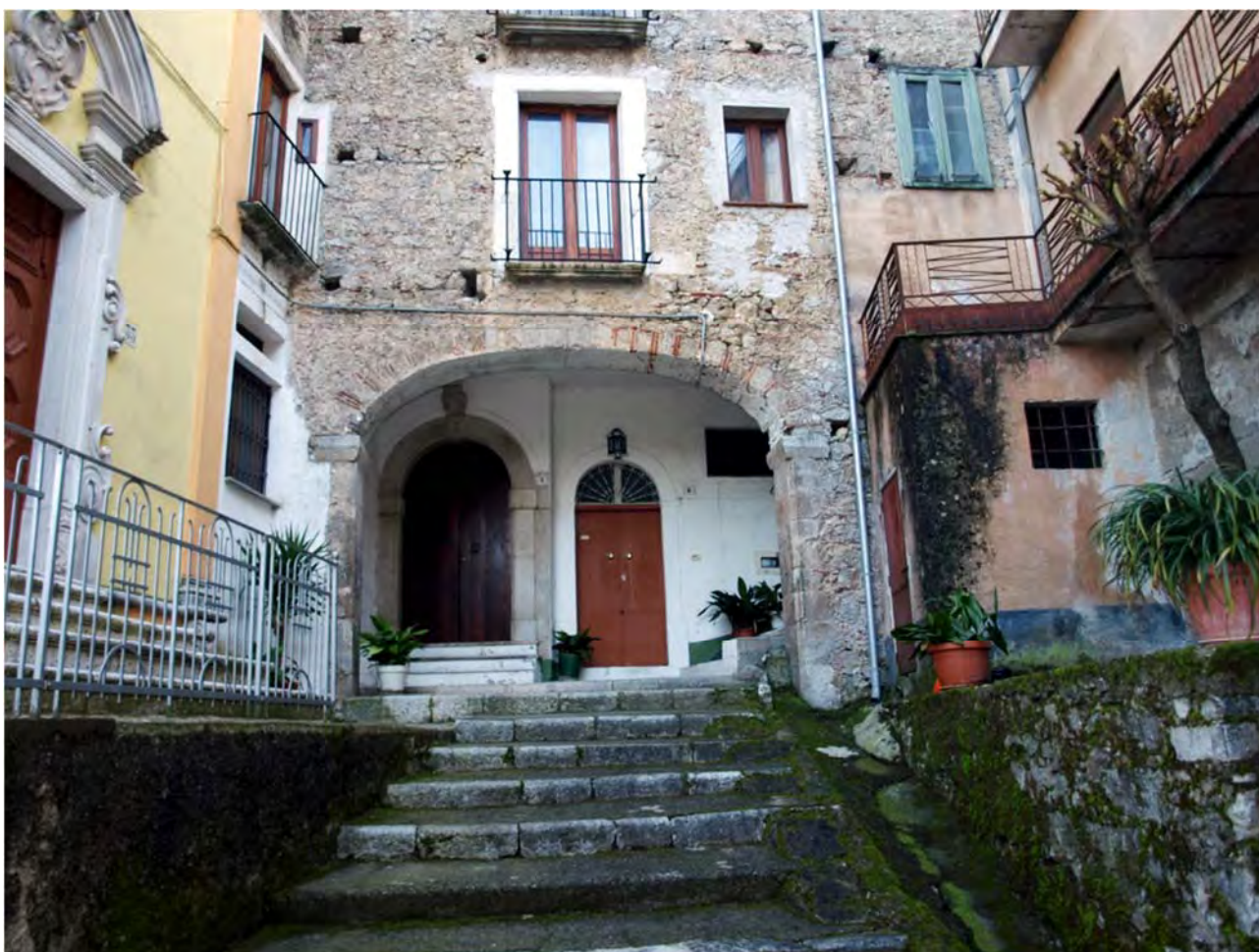
Fig. 2 – Comune di Sassano: esiti delle transizioni sull'ambiente costruito