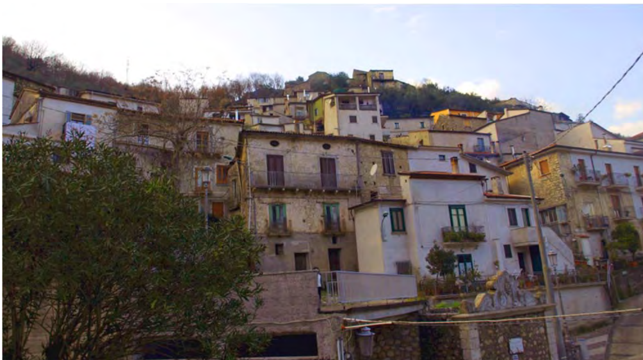
Fig. 1 – Comune di Sassano: il paesaggio storico urbano