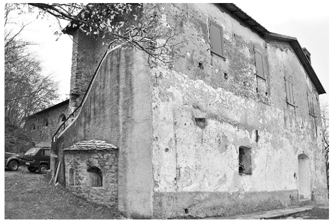
fig. 2 – Bagnasco. Chiesa di Santa Giulitta.