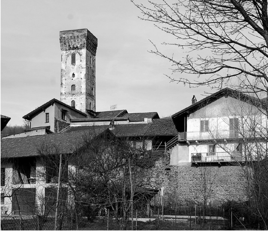
San Mauro di Almese, torre e mura del ricetto.

et fossata, valla vel motam» 91 . È evidente che la pratica di costruire strutture che, nell'immaginario dell'uomo dell'epoca, mostrassero caratteristiche associabili a un castello (altezza dell'elemento residenziale, presenza di difese periferiche) fosse piuttosto comune e celasse il desiderio di appropriarsi, giocando sull'equivoco, di diritti di norma associati a un castello propriamente detto. Se si osserva ora una qualunque delle caseforti valsusine, si constata senza grosse difficoltà che la loro articolazione corrisponde a quella che, per essere anche tipica di un castello (e, nell'area in analisi, valgono su tutti gli esempi di Bardonecchia e di Oulx), l'imperatore ricordava come fosse subordinata a un'esplicita autorizzazione: una domus un po' più robusta e un po' più alta del normale associata a un perimetro murato.