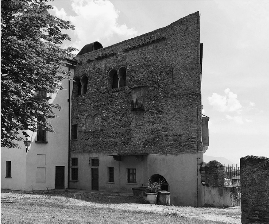
Susa, castello sabaudo: facciata del palacium verso la corte.

Il castello di Susa ancora oggi resta legato nell'immaginario collettivo alla comitissa Adelaide 22 , ultima discendente dei marchesi arduinici di Torino che, sposando in terze nozze Oddone di Savoia, per prima realizzò una provvisoria unificazione dei territori estesi sui due versanti del Moncenisio, fondamento di tutte le rivendicazioni subalpine sabaude fino alla storiografia risorgimentale. L'attuale edificio principale del castello, sebbene debitore, da un lato, delle preesistenze romane e, dall'altro, ripulmato a