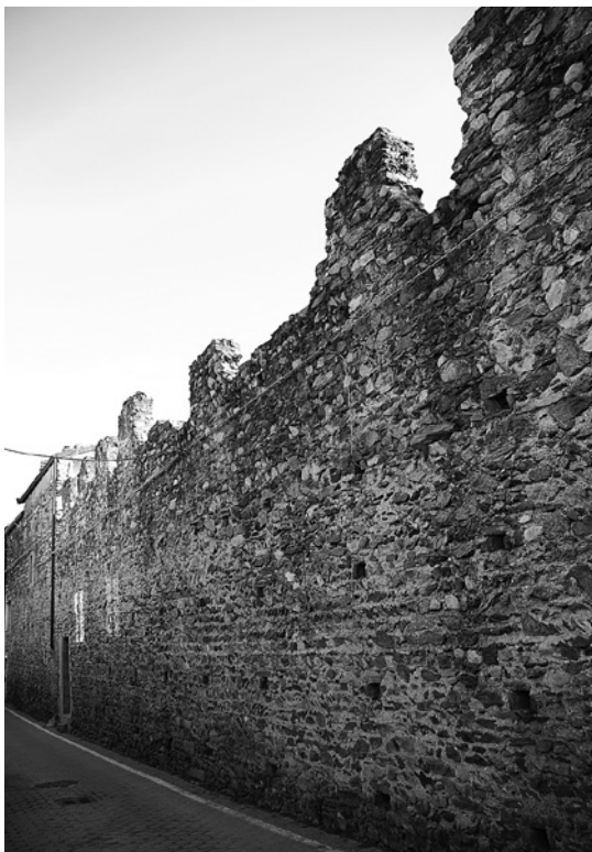
Sant' Ambrogio, mura del borgo.

Murato è anche Sant' Ambrogio, importante sede di pedaggio idealmente erede della funzione di sbarramento viario che era stata delle chiuse e soggetto alla giurisdizione degli abati di San Michele della Chiusa 84 . La cronologia dell'intervento risulta sovrapponibile a quella di Bussoleno: la cortina, ben leggibile nei settori occidentale (collegato alle strutture del più antico castello), settentrionale (concluso da una torre cilindrica di modeste dimensioni e fattura) e orientale (si conserva, sui