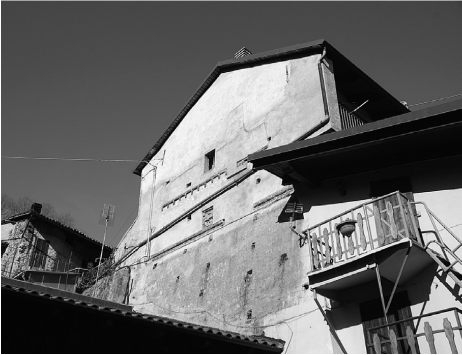
Sant' Ambrogio, castello abbaziale: murature medievali inglobate negli edifici adiacenti e pertinenti al suo recinto esterno.

turazione dell'assetto residenziale del borgo. Analizzando le architetture superstiti si ha piuttosto l'impressione di una sorta di restrictio , che se da un lato ridusse la superficie residenziale limitandosi di fatto a includere i principali edifici pubblici (la citata curia in primis ) utilizzando, soprattutto nel settore nord, un certo numero di facciate di domus preesistenti come tratti della cortina, dall'altro confermò il castello quale elemento preminente per la difesa dell'abitato.