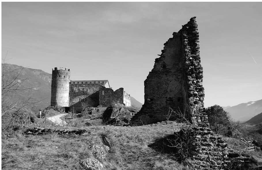
San Giorio, castello: vista dall'altura di Castel Borello e (sotto) vista dal percorso di salita dal borgo.