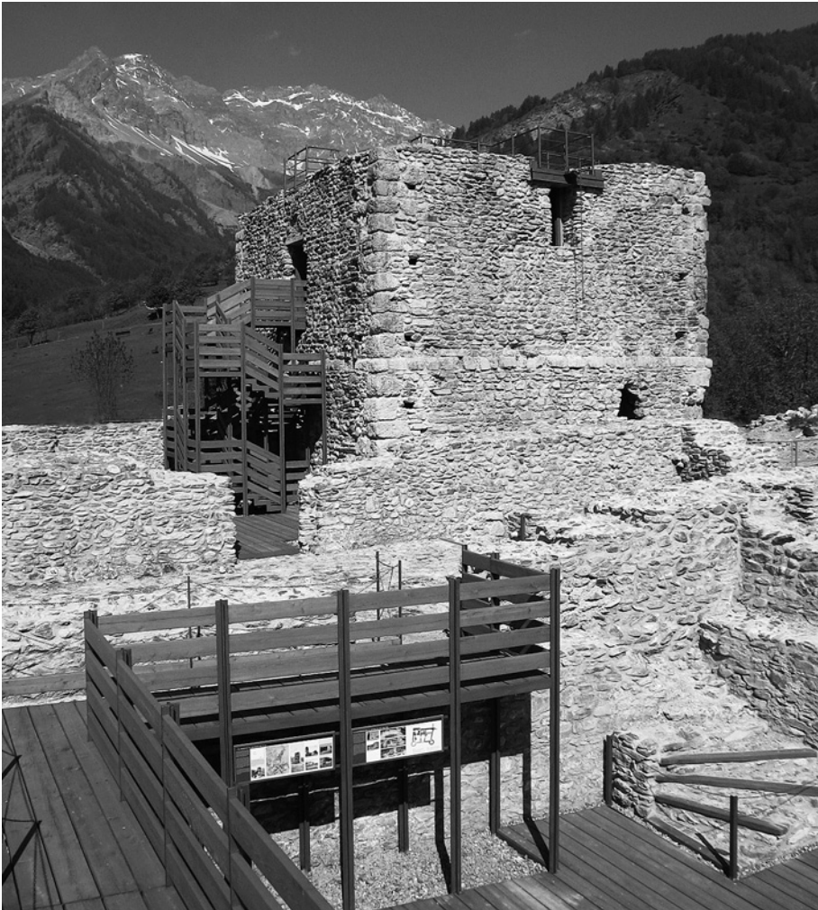
Bardonecchia, castello dei signori de Bar- donisca: allestimento del parco archeologi- co della 'Tur d'Amun'.