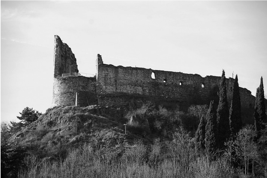
Avigliana, castello sabaudo: vista dal borgo.

L'importanza politica di Avigliana deriva dalla sua origine come curtis regia , ossia come centro di aggregazione politico, sociale ed economico controllato da funzionari pubblici, quali i marchesi di Torino erano. A essi succedettero i conti di Savoia, per via ereditaria, contrastati però nelle fasi iniziali del loro dominio dal vescovo di Torino. Dal 1176 sono attestati castellani del conte di Savoia, ossia funzionari dell'apparato burocratico comitale che gestivano il territorio, e Avigliana divenne sede di circoscrizione amministrativa e avamposto delle ambizioni sabaude verso la pianura, che si sarebbero concretizzate solo nel 1247 con la presa di Rivoli e nel 1280 con la definitiva acquisizione di Torino 29 . Una parte significativa dei proventi fiscali riscossi dai castellani era impiegata nel finanziamento di cantieri edilizi, riferibili sia a opere fortificatorie (cortine e torri) sia agli apparati residenziali, sempre più consistenti fino a costituire la finalità unica del castrum , ormai diventato luogo 'interno', privo dei rischi che aveva avuto nei secoli precedenti come avamposto militare.