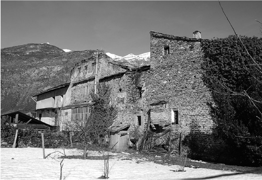
Susa, fraz. Traduerivi, fronte occidentale dell'insediamento munito.