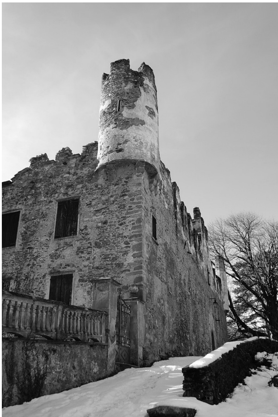
Bussoleno, fraz. Baroni, Castel Borello: torretta angolare.