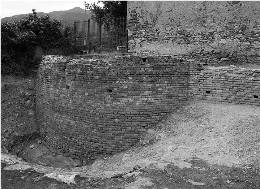
Avigliana, mura del borgo nello scavo del piazzale delle Buone Volontà: adeguamento 'alla moderna' della torre di cortina (XV secolo) in fase di scavo.

Un dato senza dubbio interessante è rappresentato dal fatto che i conti di Savoia, oltre al castello, in Avigliana possedevano un edificio anche nel borgo, con ogni verosimiglianza collocato presso la platea della beccaria. Si tratta di ciò che è alternativamente chiamato aula o curia , un complesso senz'altro meno articolato rispetto al palacium castris , ma anch'esso dotato di camere e utilizzato come luogo «ubi ius redditur et ubi reponitur [...] acta» 35 . Tale situazione non pare, peraltro, eccezionale: nel medesimo contesto territoriale, gli abati di San Michele della Chiusa possedevano, a Sant'Ambrogio come a Giaveno, i principali insediamenti soggetti al loro controllo su cui si avrà modo di tornare, sia un castrum sia