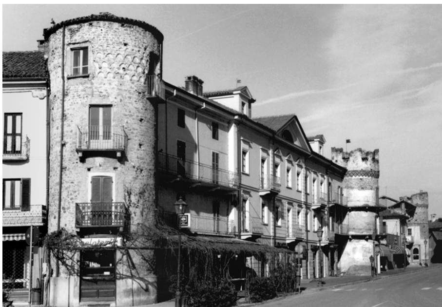
Giaveno, mura del borgo.

A Giaveno invece, altro insediamento soggetto alla giurisdizione degli abati della Chiusa, la costruzione del circuito difensivo coincide con una vera e propria fondazione di un nuovo borgo 88 . La progressiva focalizzazio-