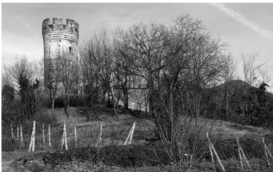
Villar Dora, torre di Molar del Ponte: vista dal castello di Sant'Ambrogio e (sotto) vista dall'area dell'insediamento.

pretendere alcun contributo dal rettore dell'ospedale gerosolimitano di San Giovanni, collocato subito al di fuori del borgo stesso «et prope portam dicti burgi deversus Bozolenum» 65 , «pro clausura ville», poiché i cavalieri erano da ritenersi esenti da ogni gravamina 66 .