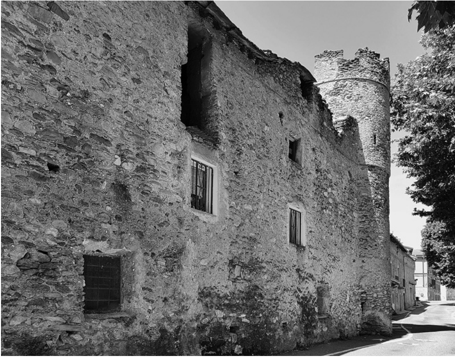
Bussoleno, mura del borgo.

In quello stesso intorno cronologico l'attenzione sabauda si appuntava, anche a causa delle turbolenze che scuotevano l'intero territorio subalpino, su insediamenti di maggior rilievo economico. Uno di questi è Bussoleno, la cui rilevanza territoriale crebbe in maniera significativa quando, verso il 1290, fu eletta a sede di una fiera che sarebbe stata, per un certo periodo, l'unica, e a lungo, invece, la più importante della castellania di Susa 78 . I proventi dell'attività commerciale crebbero esponenzialmente negli anni successivi, suggerendo l'opportunità di procedere a una rifondazione dell'abitato secondo un impianto regolare, sviluppato lungo l'asse dell' iter publicum menzionato nell'estimo del 1469 79 e nei pressi di un preesistente edificio fortificato – la casaforte dei Ferrandi, citata nel 1282 «iusta pontem Bozoleni» 80 . La posizione scelta per il nuovo abitato determinò lo