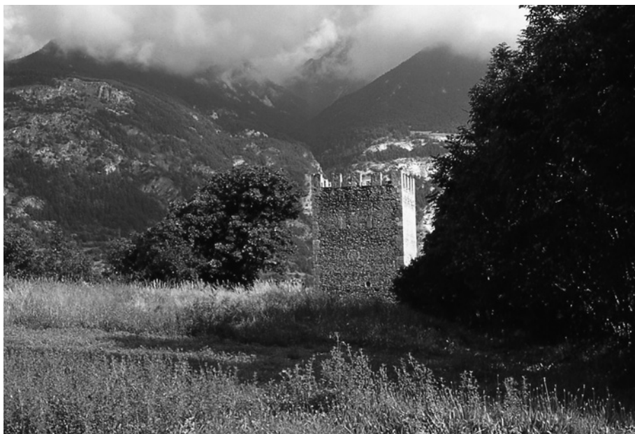
Oulx, torre delfinale.

Nel quadro delle architetture di committenza ‘statale’, Exilles costituisce il nodo fortificato principale del settore delfinale della Valle. L’amministrazione del territorio è organizzata in castellanie anche nel Delfinato: il castello di Exilles, dal XIII secolo, è il principale polo dell’alta Valle, grazie anche alla morfologia del territorio che porta la strada di fondovalle a un passaggio obbligato in aderenza al poggio fortificato del castrum , in ipotetica continuità con strutture già romane. Le numerose ricostruzioni del forte moderno hanno cancellato ogni traccia dell’edificio medievale, ben documentato tuttavia dall’iconografia storica: una turris magna cilindrica dominava il recinto più interno del complesso, attorno a cui si sviluppavano una basse cour e un ulteriore, terzo, recinto esterno 45 . Anche in questo caso è interessante valutare il rapporto tra l’opera militare e l’insediamen-