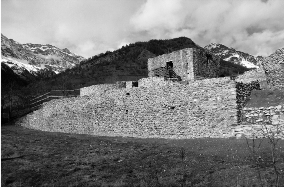
Bardonecchia, muro di cortina del castrum verso il borgo.

conservata a Grenoble, consentiva tuttavia di ipotizzare la presenza di un ampio complesso fortificato e residenziale, oggetto di accurate misurazioni e descrizioni in occasione delle inchieste condotte nel 1339 in vista del possibile acquisto dei territori delfinali da parte del papa, allora residente ad Avignone 58 . La liberazione dei resti della torre (il cui collasso risale agli anni della seconda guerra mondiale) ha permesso di individuare un perimetro quadrangolare, realizzato mediante opere di terrazzamento del versante, difeso ai due vertici meridionali da torri cilindriche 59 . All'interno della cortina sono state riconosciute diverse fasi di saturazione dell'area aperta centrale: i cantieri edilizi tardomedievali risultano finalizzati alla costruzione di spazi di rappresentanza e vita comune (scaldati grazie ad ampi camini e dotati di risorse idriche), magazzini e depositi, collegati da scale a chiocciola e