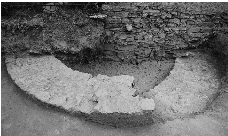
Avigliana, mura del borgo nello scavo del piazzale delle Buone Volontà: torre cilindrica sud-ovest.