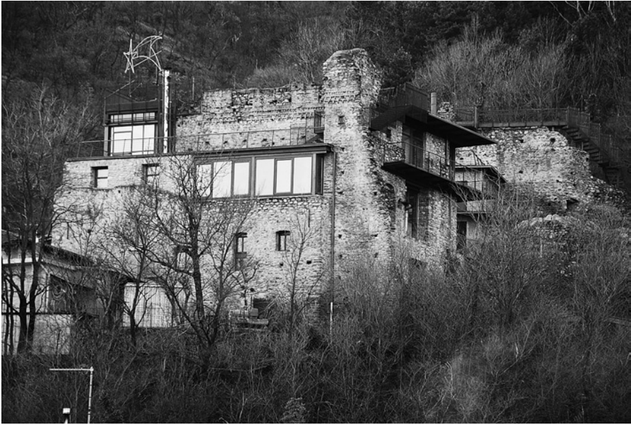
Sant'Ambrogio, castello: vista dal fondovalle.