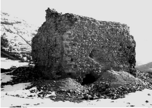
Bardonecchia, il rudere della 'Tur d'Amun' negli anni Cinquanta del Novecento.