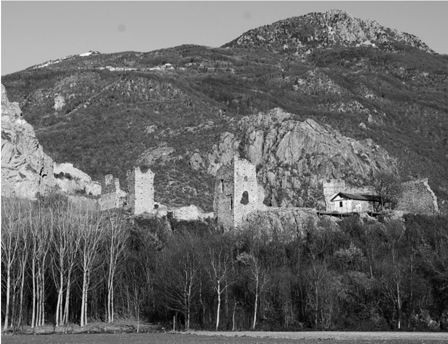
Condove, castrum Capriarum.

iniziativa e sotto giurisdizione monastica di San Giusto di Susa. Il caso è di grande interesse perché l'analisi integrata di fonti documentarie e materiali ha posto in evidenza un processo formativo diverso da quello prima evocato: il punto di partenza della struttura pare essere non una torre, ma una chiesa, in relazione con probabili strutture altomedievali ipoteticamente riferibili alle clausae 62 . A partire da tale edificio di culto di età romanica si sviluppò un insediamento che, seppur fregiato del titolo giuridico di castrum , assunse caratteri difficilmente riferibili alle dinamiche fortificatorie coeve, essendo privo di torre maestra centrale, di torri di cortina angolari o altri apparati difensivi. La qualità e la dimensione delle strutture murarie conservate (e restaurate tra il 2002 e il 2012) e le indicazioni relative all'uso residenziale di alcuni spazi testimoniano, tuttavia, la rilevanza del sito nel quadro dei paesaggi insediativi della bassa Valle, sottolineata anche dal ruolo di centro di castellania abbaziale, sebbene le fonti scritte non attestino una frequentazione intensa né particolarmente rilevante del sito nel basso medioevo.