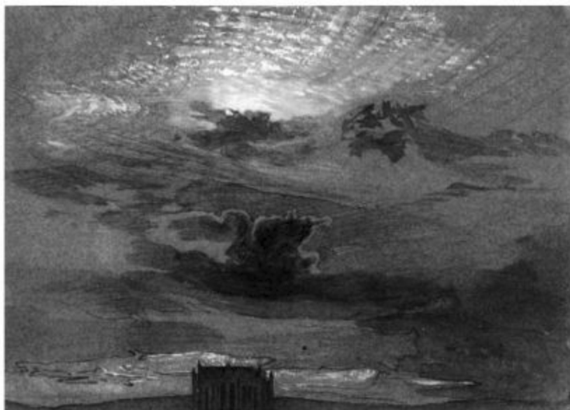
Fig. 6 J. Ruskin, Light in West, Beauvais , 1854 (Ruskin Foundation, Ruskin Library, Lancaster University).

La superbia di molti grandiosi palazzi e la ricchezza di molti sacrali ingemmati svanirà dai nostri pensieri in una nube di polvere d'oro, mentre comparirà attraverso la loro debolezza la bianca immagine di una solitaria cappella di marmo presso un fiume o ai margini di una foresta, coi suoi ornamenti a traforo floreali che si ritraggono sotto i suoi archi come sotto colte di neve caduta da poco, o la monotona vastità di un muro ombreggiato i cui blocchi di pietra, pur innumerevoli, sono come le fondamenta di una montagna. [...] E nella loro eterna testimonianza di fronte agli uomini, nel loro sereno contrasto col carattere transitorio di tutte le cose, in quella forza che, attraverso lo scorrere delle stagioni e della età, attraverso il declino e il sorgere delle dinastie, attraverso il mutare del volto della terra, e dei confini del mare, mantiene la sua proporzione scolpita per un tempo insormontabile, congiunge epoche dimenticate ed epoche che verranno, raccogliendone le simpatie, e costituisce quasi l'identità delle nazioni. E in questa patina dorata del tempo che dobbiamo cercare la vera luce, il vero colore e la vera preziosità dell'architettura 33 .