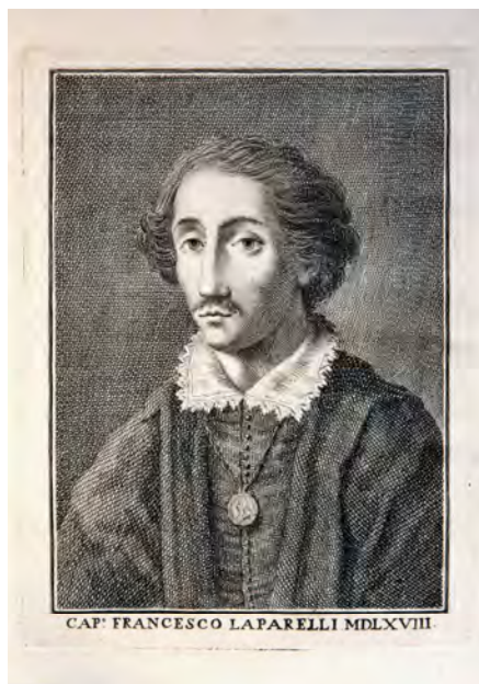
Fig. 1- Francesco Laparelli da Cortona (Filippo De Venuti, 1761).

Alla morte di Papa Paolo IV, nel 1559, venne nominato suo successore Giovanni Angelo de' Medici, con il nome di Pio IV, che mise subito il Laparelli a lavorare alle fortificazioni di Civitavecchia, cui si dedicò fino al 1560.