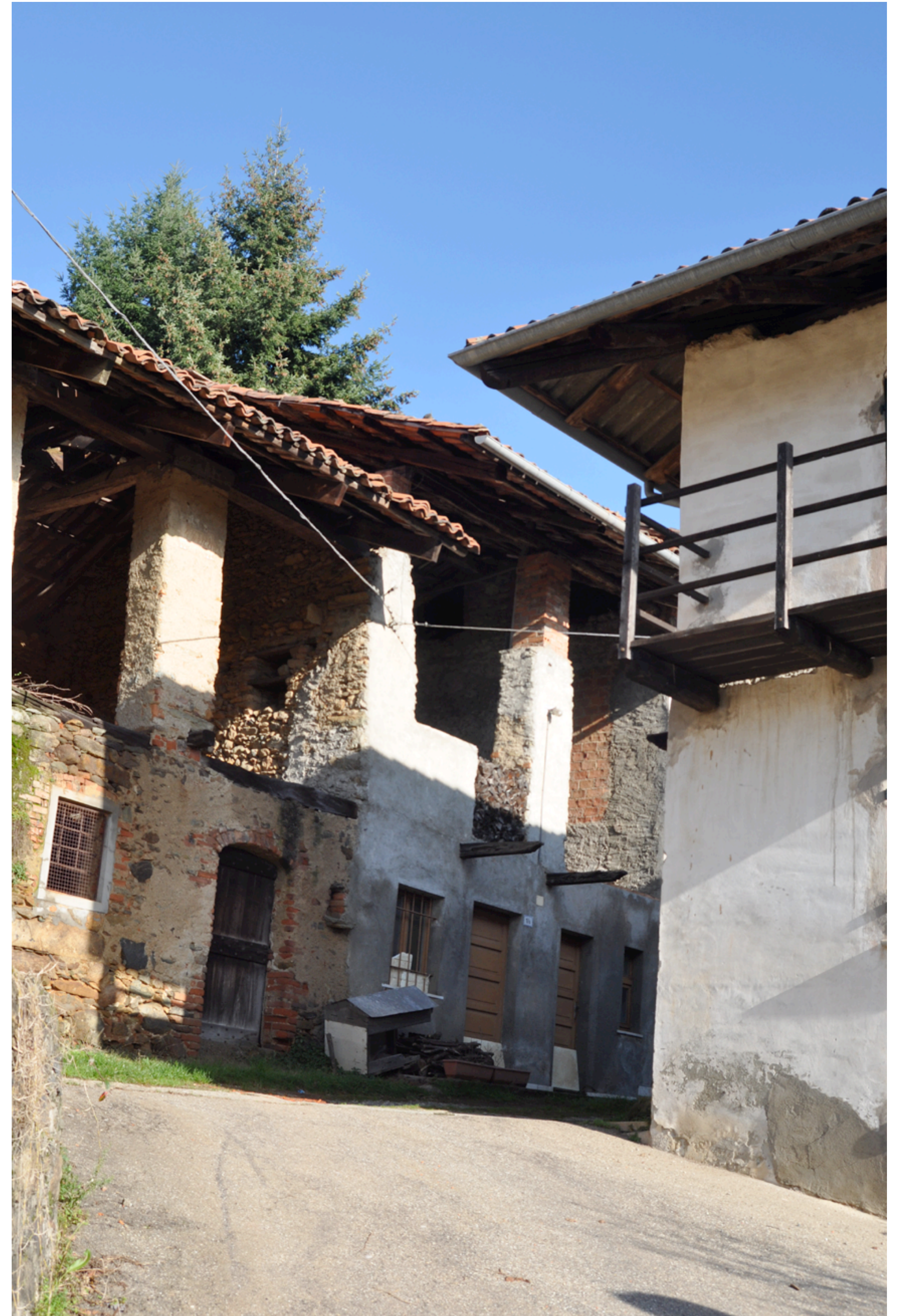
Fig. 20 - 21 - Stato attuale di un altro edificio in frazione Piletta. Il rilievo ne è risultato complesso a causa dei forti dislivelli, degli sbandamenti delle murature e delle coperture, permettendo tuttavia di cogliere gli elementi significativi per proporre soluzioni di recupero.