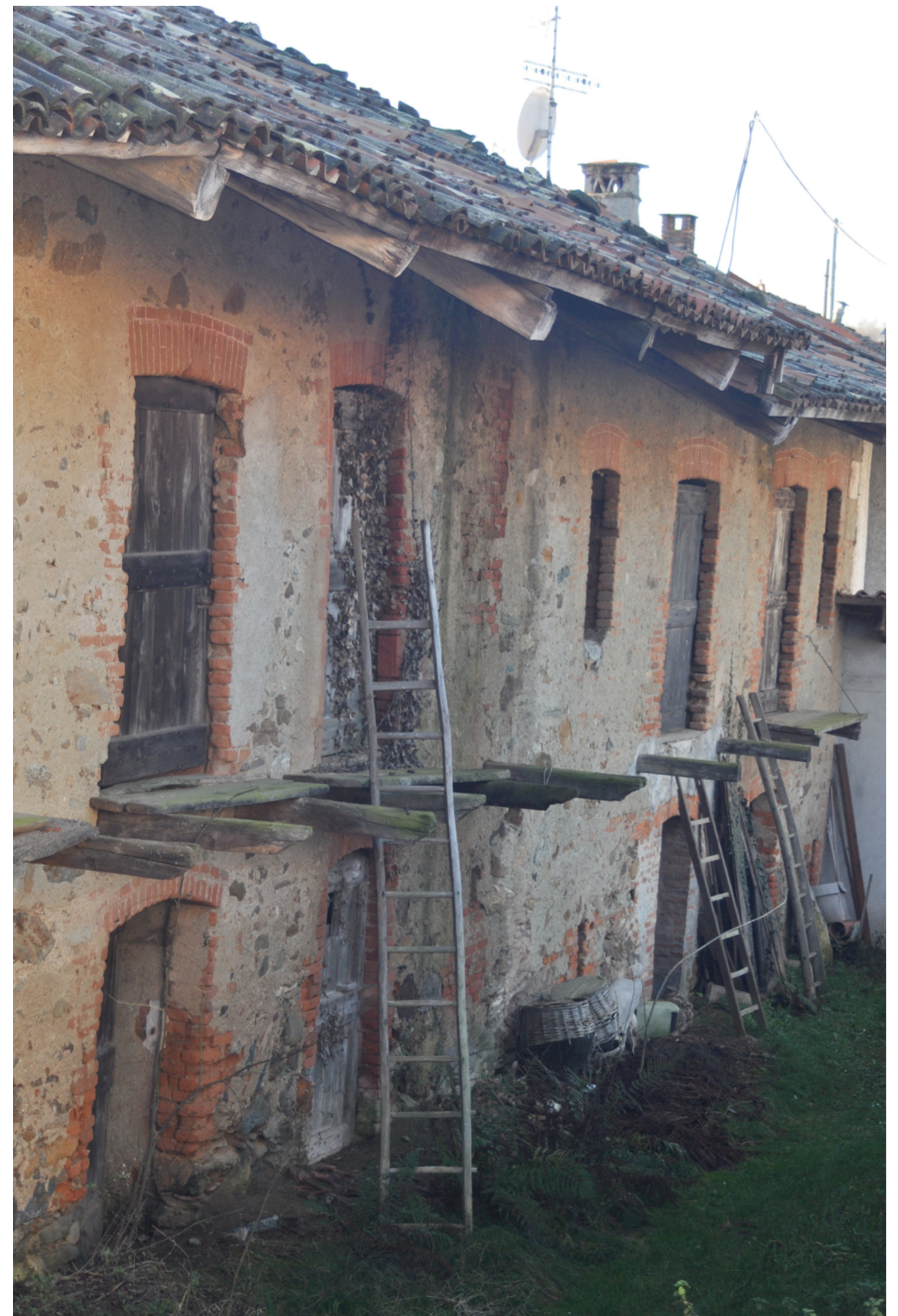
Figg. 5 - 6 - 7 - Molti fabbricati delle frazioni esternano tuttora l'originaria connotazione agricola. Qui e alla pagina seguente i casi di Carrera e di Broglina.