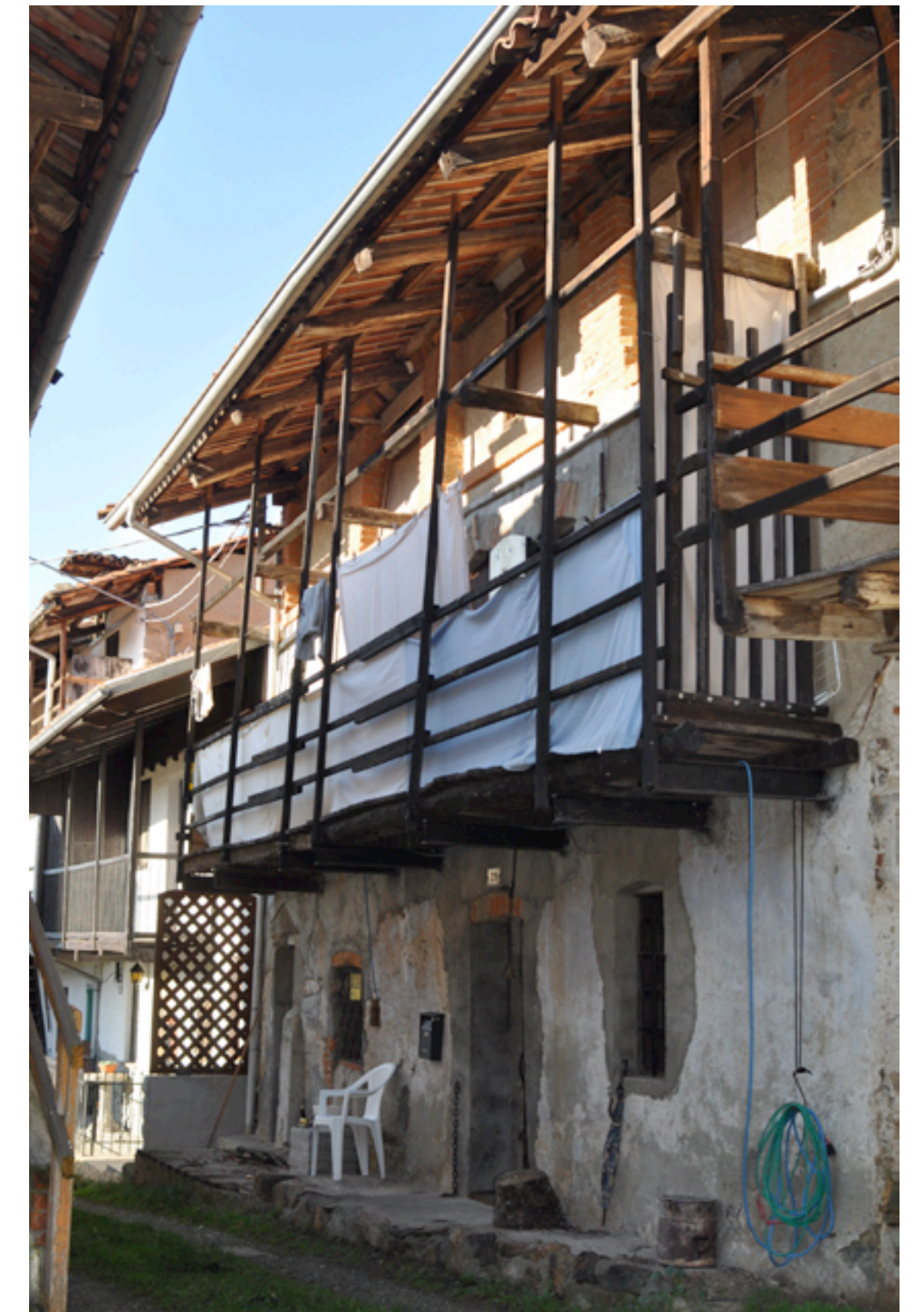
Fig. 9 - 10 - 11 - Il disegno a scacchiera dei loggiati a più piani che caratterizzano sia il paese sia le frazioni.