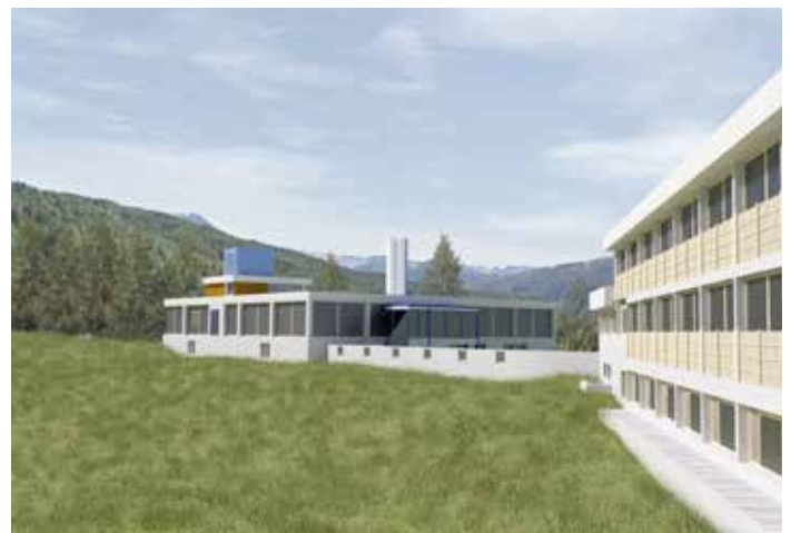
Modellazione 3D dello Ski Lodge a Sansicario (A. Borghetto, C. Drago, Tesi di laurea, Politecnico di Torino, rel. R. Tamborrino, F. Rinaudo, 2014).